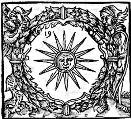
Рис. 1. Зображення герба Поділля у книзі Олександра Гваньїні (число 19 – порядковий номер рисунка).