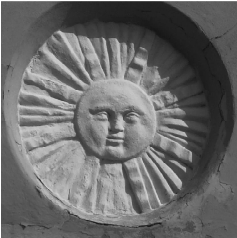
Рис. 5. Зображення герба Подільського воєводства на будівлі Ратуші.

патрона руської юрисдикції, а його зображення – на її емблемі. Герб руської юрисдикції зі зображенням св.Петра був дійсним у Кам’янці на Поділлі протягом 1491–1670 рр., тобто 180 років. Особливість герба вірменської юрисдикції полягала в тому, що зображене на ньому Боже ягня вживалося як емблема в кожній вірменській колонії України, у тих випадках, якщо вірменська громада користувалася судово-адміністративною автономією. Герб вірменської юрисдикції з емблемою у вигляді Божого ягняти існував офіційно в Кам’янці від 1496 до 1790 рр., тобто 295 років 17 .