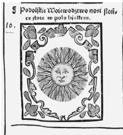
Рис. 2. Зображення герба Поділля у книзі Бартоша Папроцького “Гніздо цноти”.