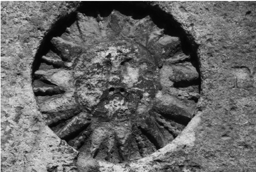
Рис. 6. Зображення герба Подільського воєводства на кам'яному пілоні на Старопоштовому узвозі.

ства та Речі Посполитої, то можна легко побачити суттєві відмінності між ними. Жодне із зображень не повторюється. Добре відомо, що оскільки в Польському королівстві, до якого входило Поділля, не існувало герольдії – спеціального органу, який би затверджував герби, – тому кожний художник, або ж кожний книговидавець передавав зображення геральдичних фігур по-своєму. Незмінним для подільського герба залишалося лише Сонце з людським обличчям. Цікавими для нашої теми є епіграфічні пам'ятки. Так, зображення герба Подільського воєводства на Ратуші в Кам'янці-Подільському датується не пізніше 1754 року (саме тоді проведена її реконструкція, про що свідчить пам'ятна дошка над Сонцем). А от на кам'яному пілоні, що знаходиться на Старопоштовому узвозі, зображення герба Поділля датується 1763 роком.