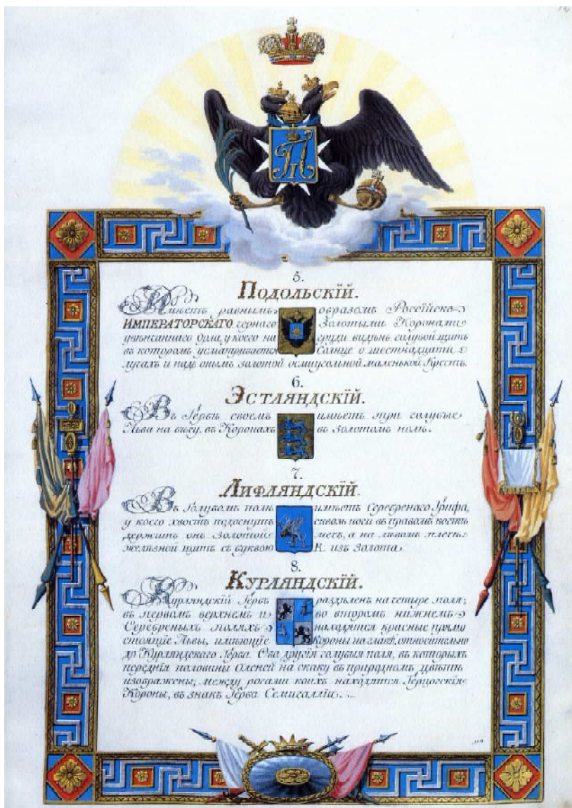
Рис. 8. Зображення герба Поділля на одній із сторінок "Маніфесту про повний герб Всеросійської імперії".