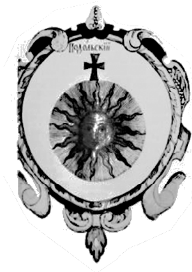
Рис. 7. Зображення герба Поділля з "Титулярника" 1672 року.

ництва як Стара Ушиця, Зіньків, Городок, Ямпіль, Базалія у долішній частині герба отримали зображення, які розробили петербурзькі герольдмейстери. Наприклад, потенційні торговельні можливості Базалії, яка знаходилася недалеко від кордону, символізували в лазуровому полі дві руки, подані одній і покладені на товарах, зв'язаних у два срібних тюки. У гербі Зінькова у долішній частині – у лазуровому полі покладені пірамідально срібні плити, на знак того, що в тамтешніх місцях у великій кількості видобувається каміня для фундаменту та вапняку. Досить фантастично виглядає герб Городка. У його долішній частині – на знак розташування міста між горами, – в червоному полі дві золоті гори з боків, а між ними – міська срібна стіна 23 .