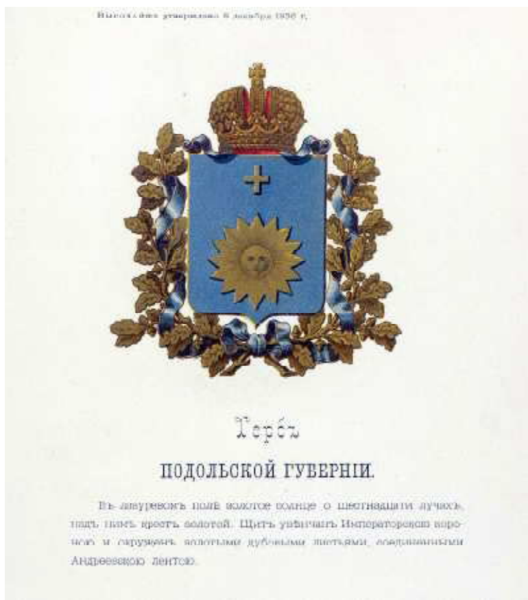
Рис. 9. Зображення нового герба Подільської губернії (1856 р.).

линців (затверджено у січні 1991 року), Сатанова (затверджено 23 червня 1989 року). Ці герби, як зазначав Ю.Савчук, об'єднуються деякими спільними рисами: це характерний поділ щита, зображення у вільному полі золотого усміхненого сонечка, написи – назви міст. Хоча проекти Б.Б.Шулевського позначені прагненням опертись на історичну традицію, проте це прагнення не завжди послідовне. Невдалими були спроби Б.Б.Шулевського поєднати давні й новочасні символи. У 1960–1980 роках Б.Б.Шулевський ввів до опису створених ним ескізів гербів нове поняття – “український щит”. Хоча зображення були вміщені в доволі традиційну для Європи