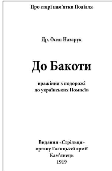
Осип Назарук періоду роботи над книгою. Обкладинка книги.