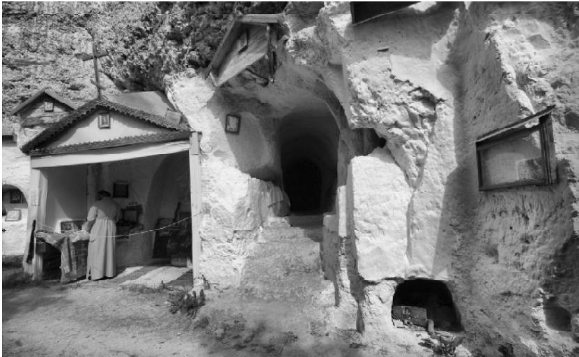
Залишки скельного монастиря (сучасне фото).

13. Колодівка – село Ушицького повіту (сучасний Кам'янець-Подільський район). Розташована неподалік Бакоти.