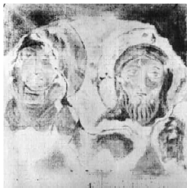
Копії фресок з Бакотського монастиря.

а в багатьох похованнях не вистачало частин скелету, які рознесли селяни. Щоб припинити це пограбування, було вирішено скласти кістяки в одну з ніш і закрити їх.