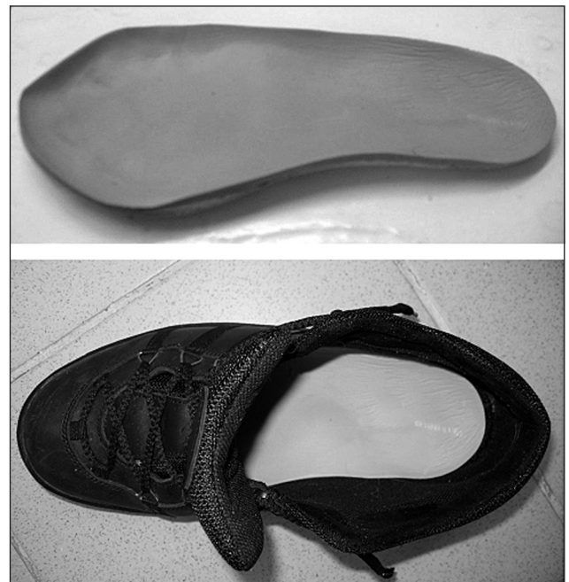
Рис. 2. Ортез на стопу (устілка) в комплексі з малоскладним ортопедичним взуттям

Показання до ортезування встановлено 29 хворим на ДНОАП. П'ятьом пацієнтам з гострою стадією проводили фіксацію надп'яtkово-гомількового сугло-