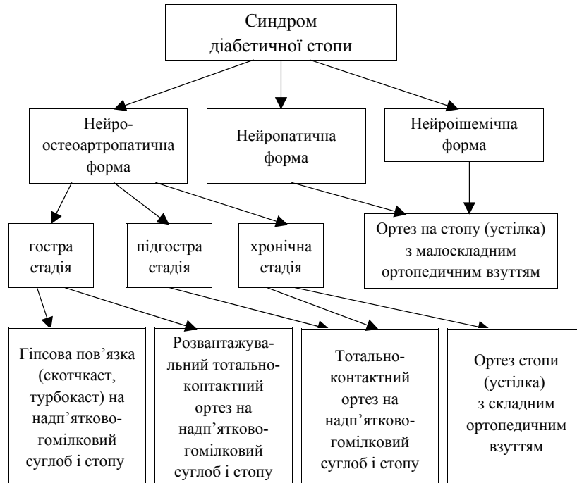
Рис. 1. Схема призначення ортопедичних засобів хворим з синдромом діабетичної стопи

симвастатин та аторвастатин для зниження рівня холестерину у сироватці крові.