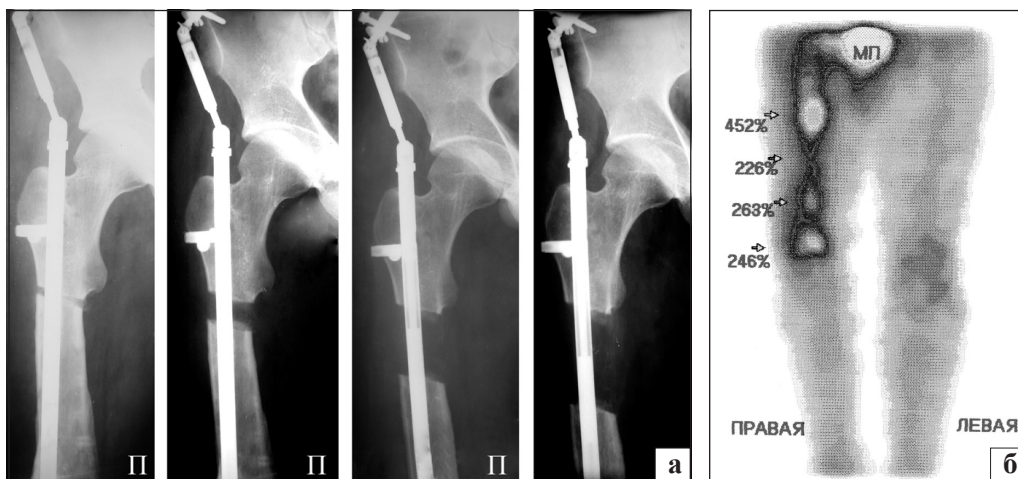
Рис. 5. Рентгенограммы (а) и остеосцинтиграмма (б) правой бедренной кости больного В., 19 лет, в процессе дистракции

тяжистой тени дистракционного регенерата больному разрешили полную нагрузку на оперированную конечность. Дистракционный аппарат удален через 1,5 года после его имплантации, результат оценен как хороший (рис. 6).