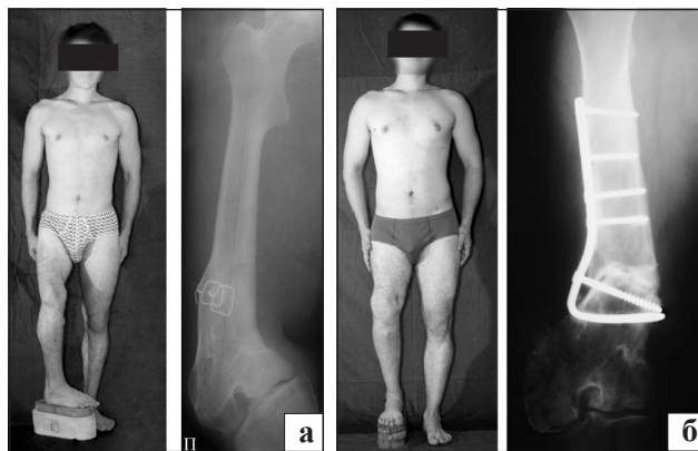
Рис. 4. Больной В., 18 лет. Укорочение (13,5 см), многоплоскостная деформация правого бедра, разгибательная контрактура правого коленного сустава. Внешний вид и рентгенограмма правой бедренной кости до (а) и после операции (б)