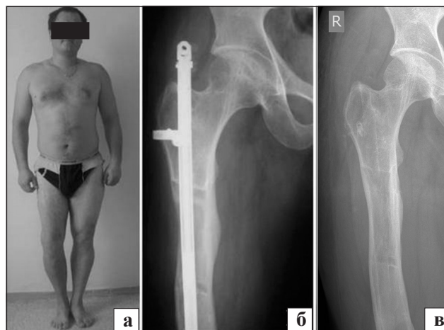
Рис. 6. Больной В., 20 лет: а) внешний вид; б) рентгенограмма правой бедренной кости в период фиксации; в) рентгенограмма после удаления аппарата

Следует отметить, что удлинение бедра имплантируемой конструкцией позволяет уже в процессе дистракции применять методы восстановительного лечения, которые направлены на сохранение движений в смежных суставах, релаксацию мышц удлиняемого сегмента, нормализацию микроциркуляции и метаболизма тканей. С этой целью в процессе дистракции, еще на этапе стационарного лечения, инструктор дважды в день проводил занятия лечебной физкультурой. Кроме того, пациенты самостоятельно выполняли упражнения, направленные на сохранение движений в коленном и тазобедренном суставах. Через 30–40 дней после начала дистракции