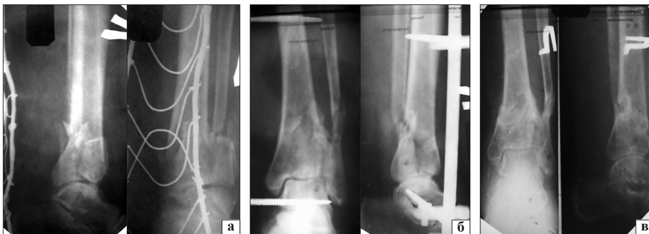
Рис. 1. Рентгенограммы пациентки Ш.: а) до лечения; б) после операции: сопоставление отломков дистального эпифиза относительно удовлетворительное, в профильной проекции видна ступенька суставной поверхности высотой около 3мм; в) через 9 недель после операции

Первичные результаты хирургического лечения повреждений pilon по предложенной технологии позволяют утверждать, что при переломах типа В и С в 64 % случаев путем дистракционного лигаментотаксиса удалось анатомично реконструировать суставную поверхность большеберцовой кости. При этом не применяли травматичных и опасных операций открытой репозиции, неукоснительно соблюдая принципы биологического остеосинтеза.