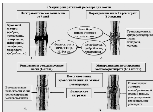
Рис. 1. Стадии формирования регенерата после диафизарного перелома у человека

Среди многочисленных факторов роста обращают на себя внимание ИФР-1 и ИФР-2, которые являются одними из важнейших гормональных посредников и регуляторов гормона роста [22]. ИФР