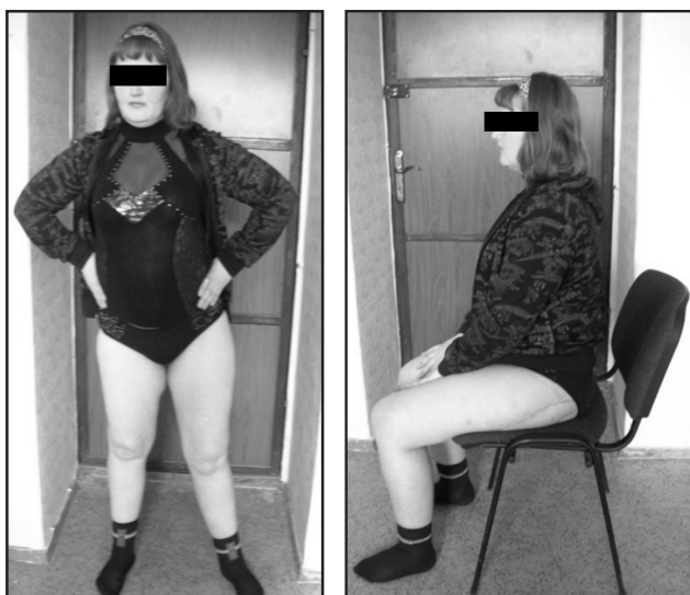
Рис. 5. Функциональный результат лечения больной Г. через 3 года