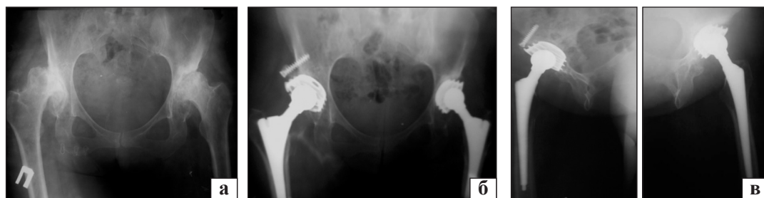
Рис. 2. Рентгенограммы тазобедренных суставов больной К.: до операции (а), после (б) и через 5 дней (в)

Пациентка К., 43 года, диагноз: двухсторонний ДК, III тип по Stowe справа, II — слева. Выполнено двухстороннее эндопротезирование ТБС путем низкой межвертельной остеотомии бедренных костей с применением конических ножек и ввинчивающихся чашек в сочетании с костной пластиной крыши ВВ (рис. 2). При осмотре через 5 дней функция сустава хорошая (рис. 3).