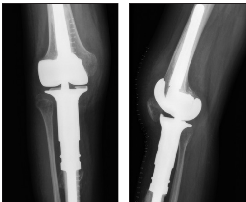
Рис. 3. Рентгенограми пацієнтки М. після ендопротезування колінного суглоба модульним ендопротезом MUTARS

Таким чином, після хірургічного лікування 16 хворих на ГКП проксимального відділу великогомілкової кістки (виконання резекції пухлини «en bloc»), модульного ендопротезування, реінсерції м'яких тканин на тіло ендопротеза та пластики розгинального апарата колінного суглоба досягнуто добрі функціональні результати (за шкалами MSTS — (72 \pm 12) %, TESS — (74 \pm 16) %) без рецидивів пухлини в жодному випадку протягом періоду спостереження від 6 міс. до 14 років. Ускладнення спостерігали в 3 (18,7 %) випадках, серед них 2 (12,5 %) — з перипротезною інфекцією (IV тип за класифікацією E. R. Hendsen), 1 (6,2 %) — травматичні ушкодження розгинального апарата (I тип за класифікацією E. R. Hendsen).