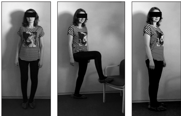
Рис. 4. Фото хворої М., функція колінного суглоба через 2 міс. після ендопротезування модульним ендопротезом MUTARS