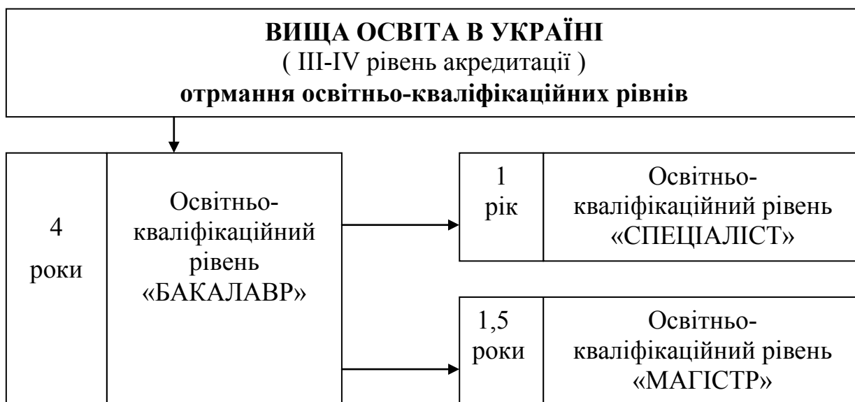
Схема 1. Рівні вищої освіти в Україні

Законодавчо держава проявляє турботу по відношенню до випускників вищих навчальних закладів, тому і наділяє освічену молодь особливим правовим статусом – молодий спеціаліст. Молодим фахівцям