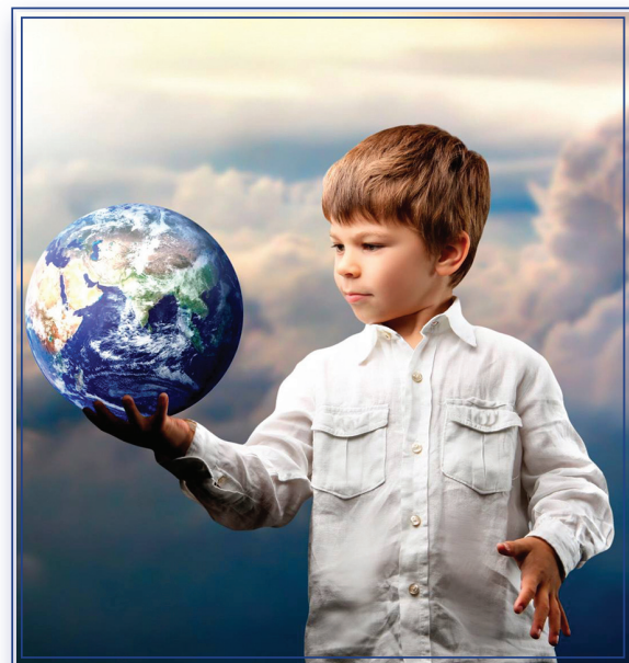
Рис.1. Саморозвиток можливостей поліпшення впорядкування особистістю життєвих актів