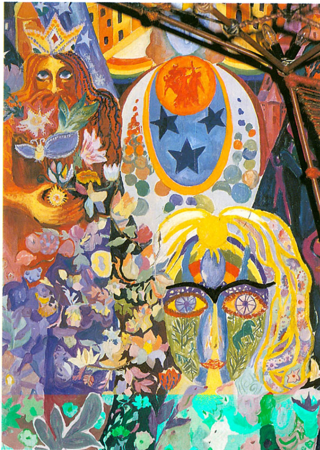
Фото 3. Фрагмент монументальной росписи в «Комнате сказок» Российской государственной детской библиотеки (1990 г.)

и взаимопонимания. Например, для того, чтобы дети не боялись давать разные ответы на один вопрос, можно на первом же занятии задать такую тему: Как вы думаете, кто такой художник, что это за человек?