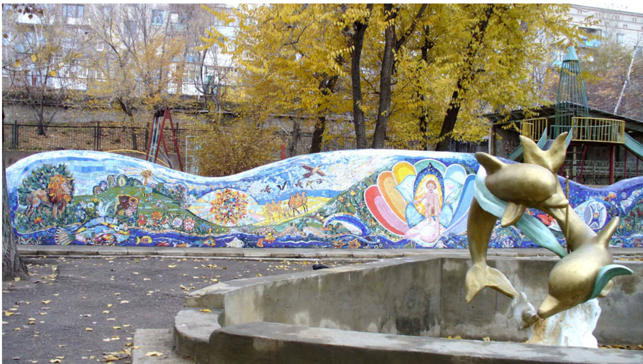
Фото 5. Фрагмент мозаичной композиции «Человек – дитя Природы»

Так уникальное и неповторимое мозаичное панно «Человек – дитя Природы» на территории детского сада № 132 «Василёк» Ленинского района Саратова, было создано в течение 2 лет (см. фото 6, 7). Монументальное искусство – искусство синтеза, и естественно, выполняя коллективные работы в интерьере и панно на территории детских садов, учащиеся вместе с педагогами изучали не только живопись и рисунок, но и дизайн, учитывая целевые, функциональные особенности пространства. Так было и при создании мозаичного панно. В процессе работы для каждого ученика решались воспитательные задачи. Их воспитателем была совместная деятельность на благо людям, в конкретном случае для детей детского сада.