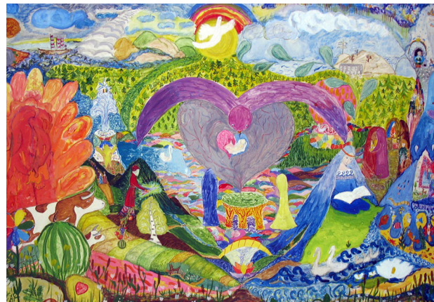
Фото 7. Фригмент композиции «Гимн Саратовской земле»