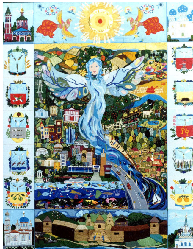
Фото 4 57

Все это способствует тому, как отмечают педагоги студии и родители, что дети становятся целеустремленными, инициативными, организованными, активными, трудолюбивыми, ответственными. Коллектив, который образовывается в процессе такой деятельности, становится сплоченным и творческим, а произведения созданные детьми восхищают цельностью и гармонией.