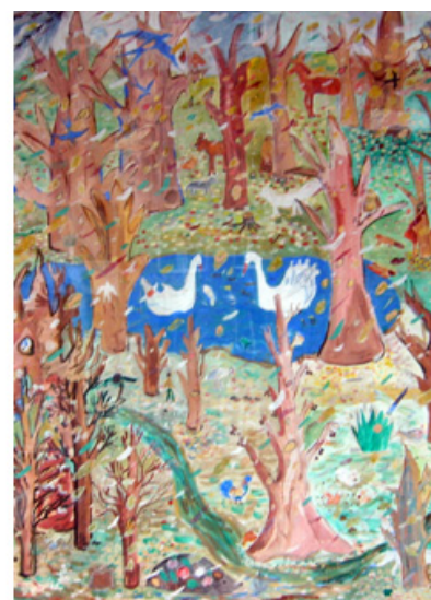
Фото 8. Оформление фасада детской поликлиники – «Гимн Саратовской земле»

происходит развитие познавательной и социальной активности.