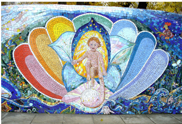
Фото 6. Фрагмент мозаичного панно «Человек – дитя Природы»

В 2009 году в городском конкурсе «Лето! Отдых! Клуб!» в номинации «Лучший творческий проект» за мозаичное панно «Студия воспитания искусством» была награждена дипломом. Средствами массовой