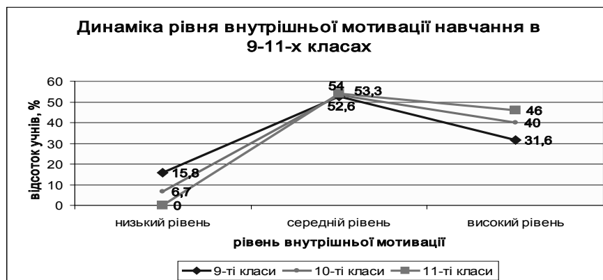
Рис. 1. Аналіз динаміки внутрішньої мотивації ліцеїстів упродовж трьох років навчання в ліцеї

Учням пропонується взяти участь у предметних олімпіадах, всеукраїнських іграх-конкурсах («Геліантус», «Левеня», «Кенгуру», «Соняшник»). Посідаючи