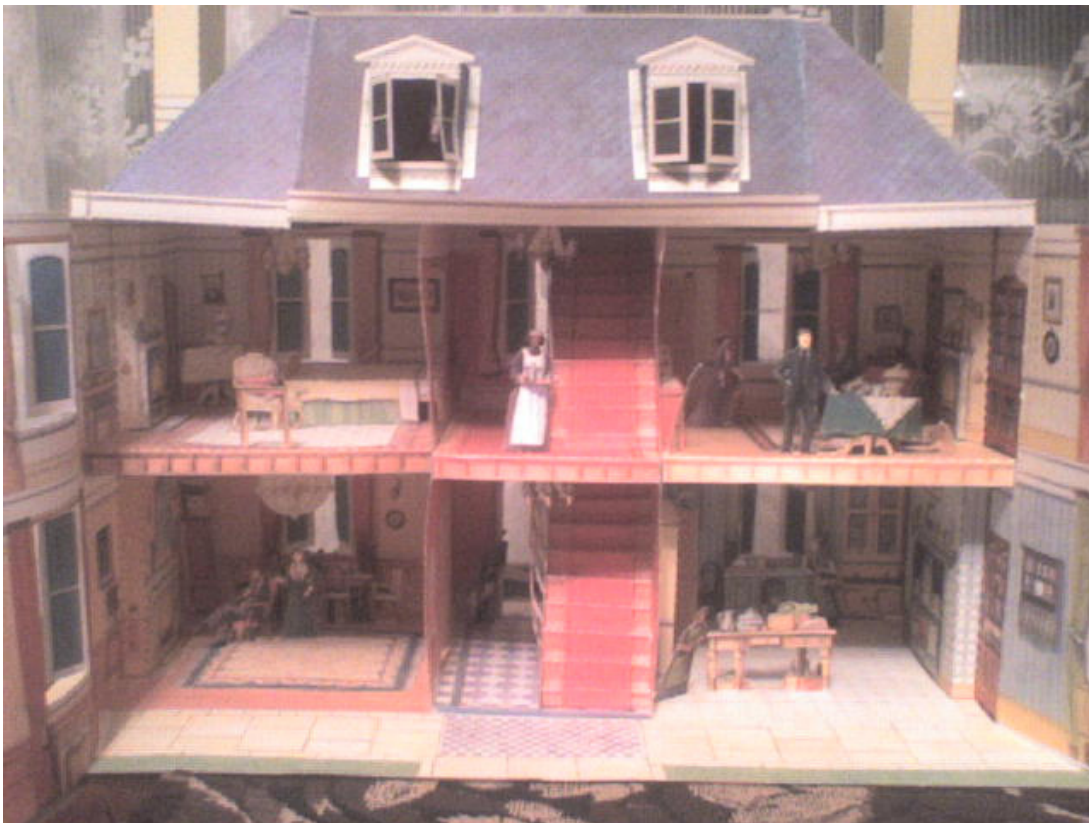
Мій ляльковий будиночок