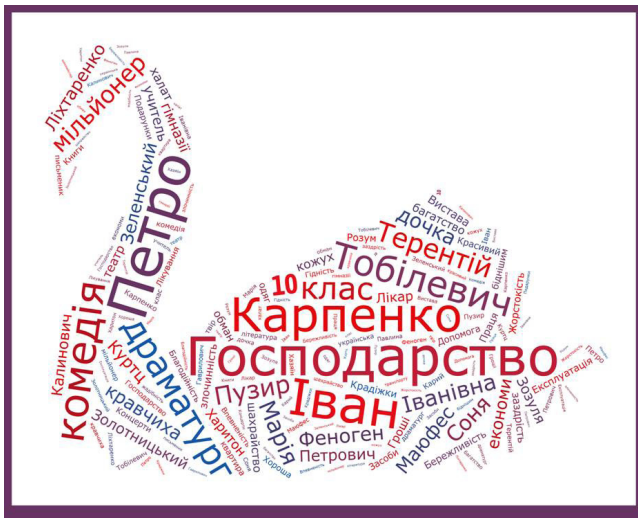
Рис. 2. «Хмарка слів» до комедії І. Карпенка-Карого «Хазяїн»

net/, http://worditout.com/ , http://tagul.com , http://www.imagechef.com/ic/word_mosaic/ ). Більшість з них не вимагають реєстрації та надають можливість генерувати «хмари» з тексту, що вводить користувач, змінювати розмір і колір слів та фону.