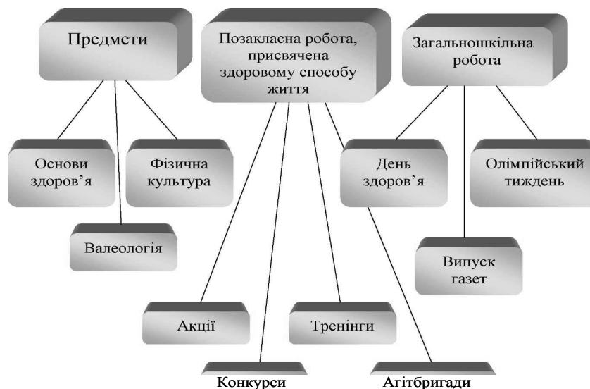
Рис. 3. Модель організації роботи з впровадження здоров'язбережувальних технологій в основній та старшій школі

Тому пошук виховних заходів впровадження здоров'язбережувальних технологій, що сприятимуть ставленню молодого покоління до свого здоров'я як вищої цінності та формуванню потреби в здоровому способі життя, є головним завданням для досягнення мети збереження здоров'я людини. У школі необхідно впроваджувати програми з формування навичок здорового способу життя дітей і підлітків. Завдяки різним формам роботи в учнів розвиваються логічне мислення, уява, навички самостійного пошуку знань. Під час використання творчих завдань учні використовують міжпредметні зв'язки та доступні джерела інформації. Організацію роботи щодо зміцнення здоров'я учнів можна представити у вигляді схеми (рис. 3).