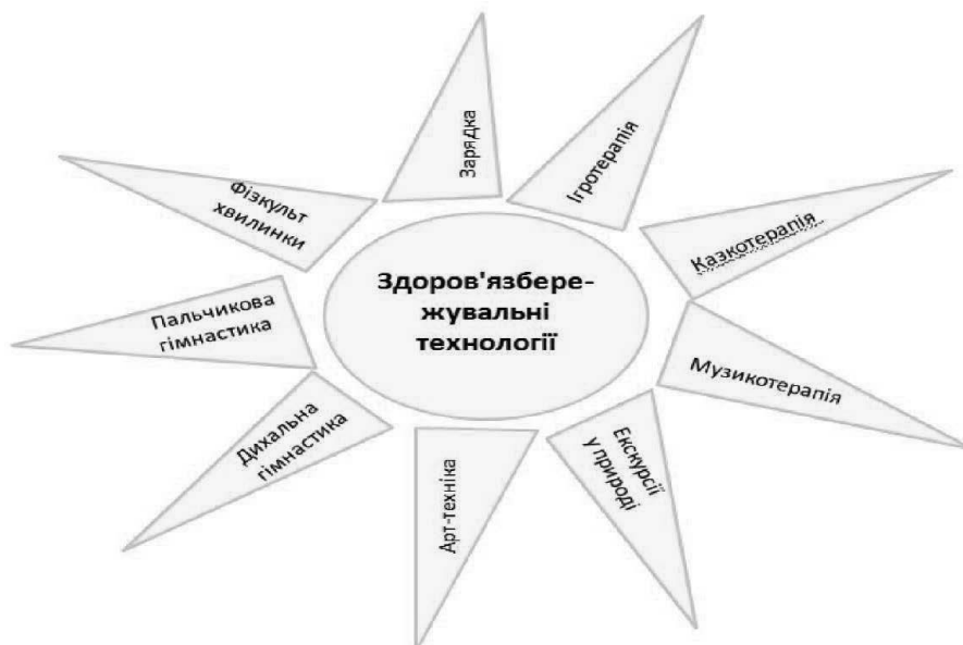
Рис. 2. Модель впровадження здоров'язберезувальних технологій в початковій школі

Основним видом діяльності учнів молодших класів є гра. Важливо проводити упродовж уроку дві фізкультхвилинки у формі гри, перед початком навчальних занять – зарядку. Покращує стан здоров'я дитини