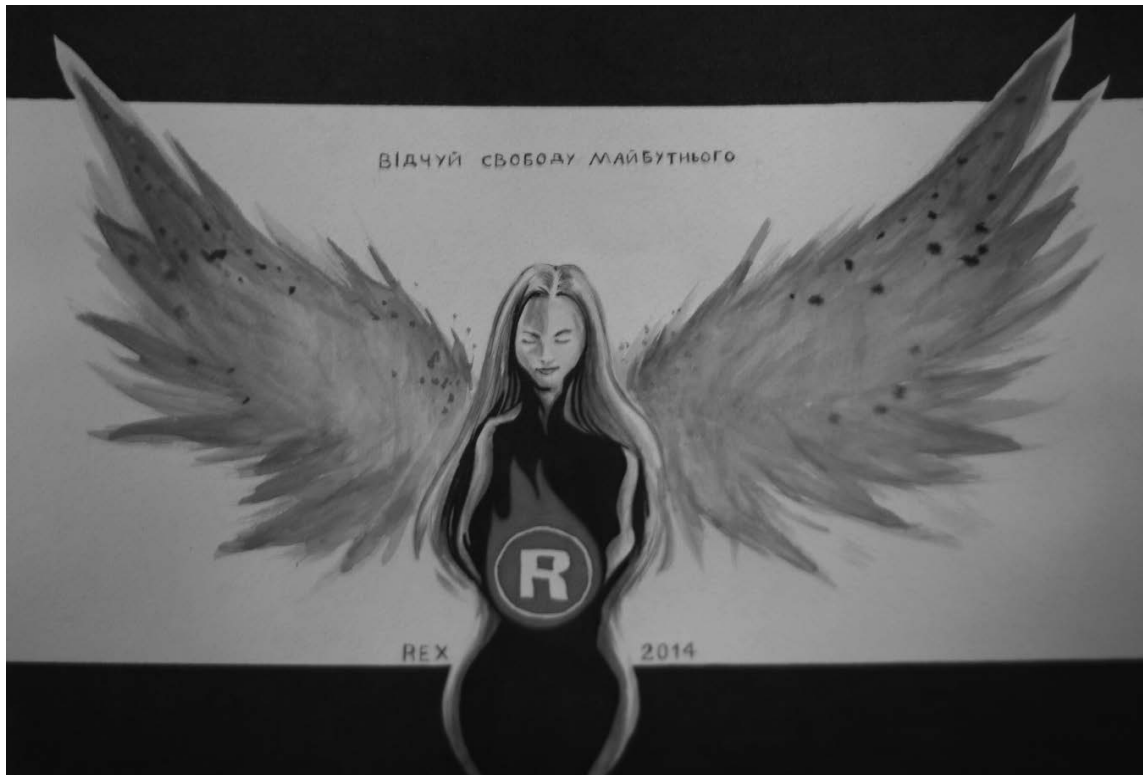
Відчуй свободу майбутнього