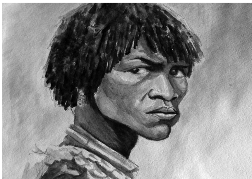
Портрет – Африканець