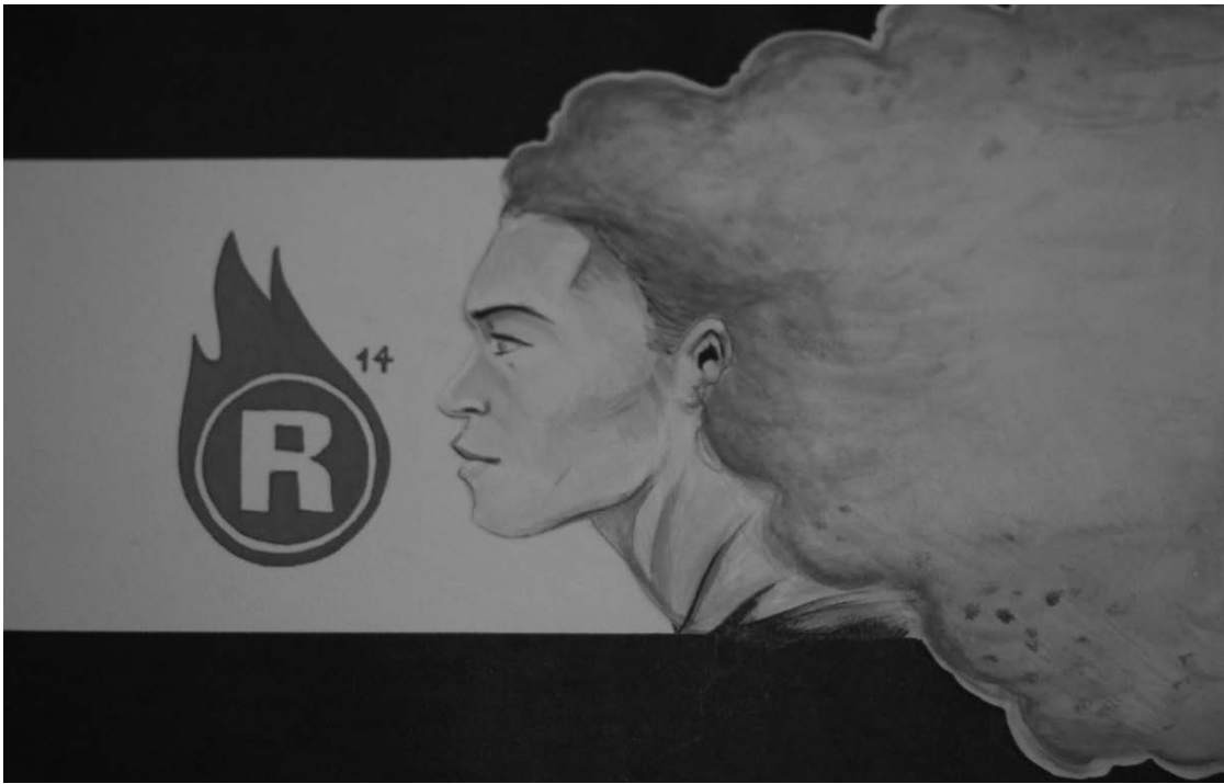
Жінка в рекламі