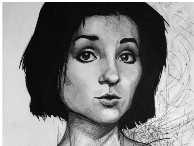
Портрет – Здивування