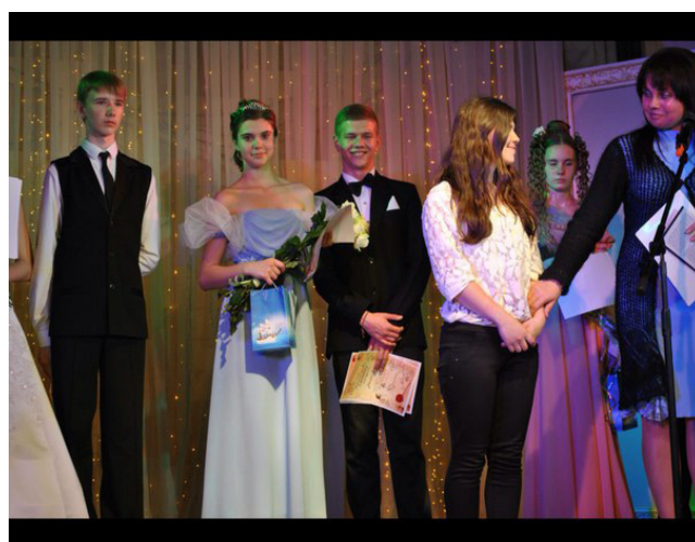
Разом з учасниками конкурсу «Пушкинская красавица» на сцені Херсонського обласного драматичного театру імені М. Куліша