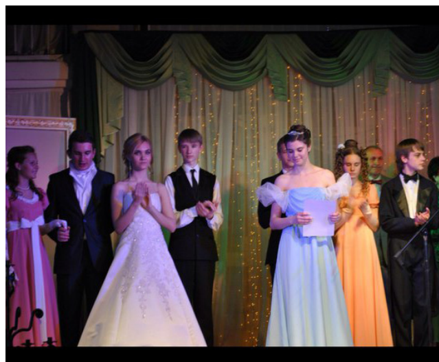
Гран-прі конкурсу «Пушкинская красавица»