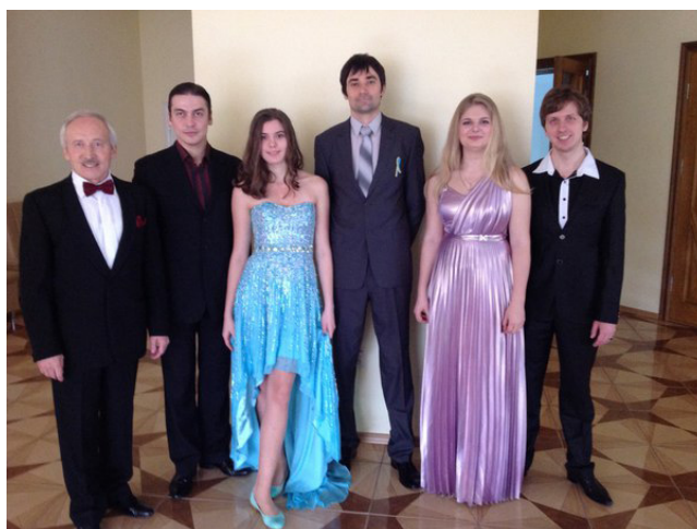
Наймоладша учениця серед відомих випускників Заслуженого артиста України В. Т. Гурби