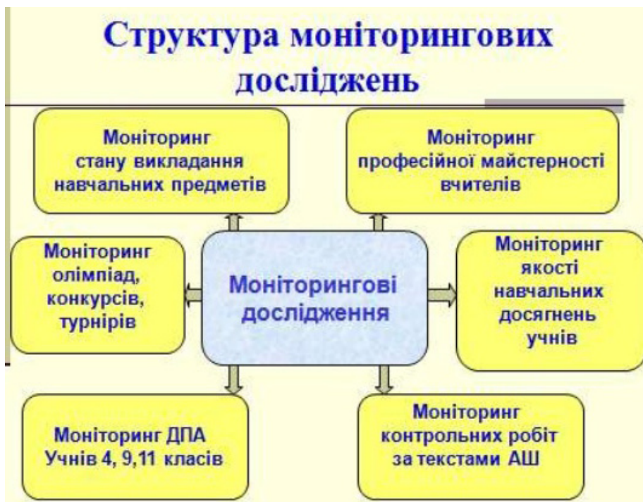
Рис. 1. Структура моніторингових досліджень

Особливо цікавий та позитивний вплив мали семінари В. О. Киричука та Ш. О. Амонашвілі на основі комплексів програм Universal-3, Universal-4 та Personal. Ці дослідження стали цікавими для вчителів, які були залучені до проведення досліджень з використанням цих комплексів програм.