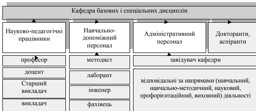
Рис. 1. Організаційна структура кафедри ІДП НАУ