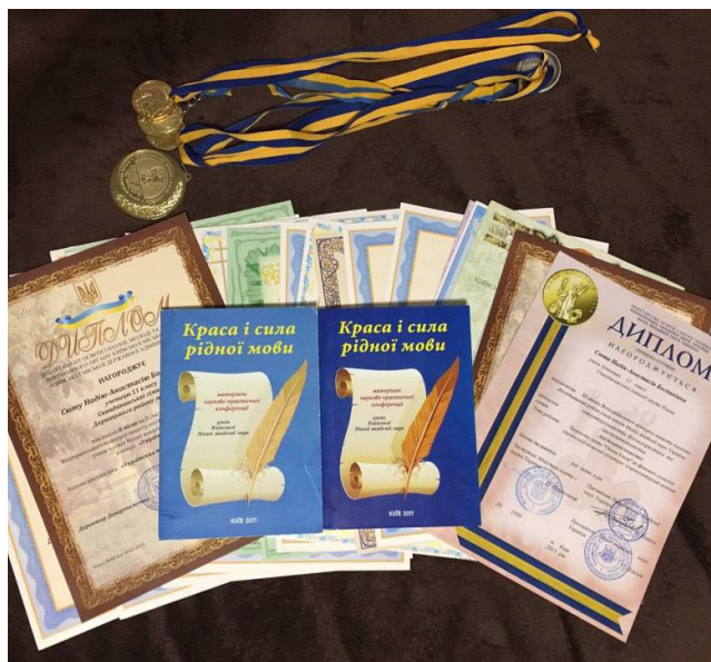
Мої перші нагороди