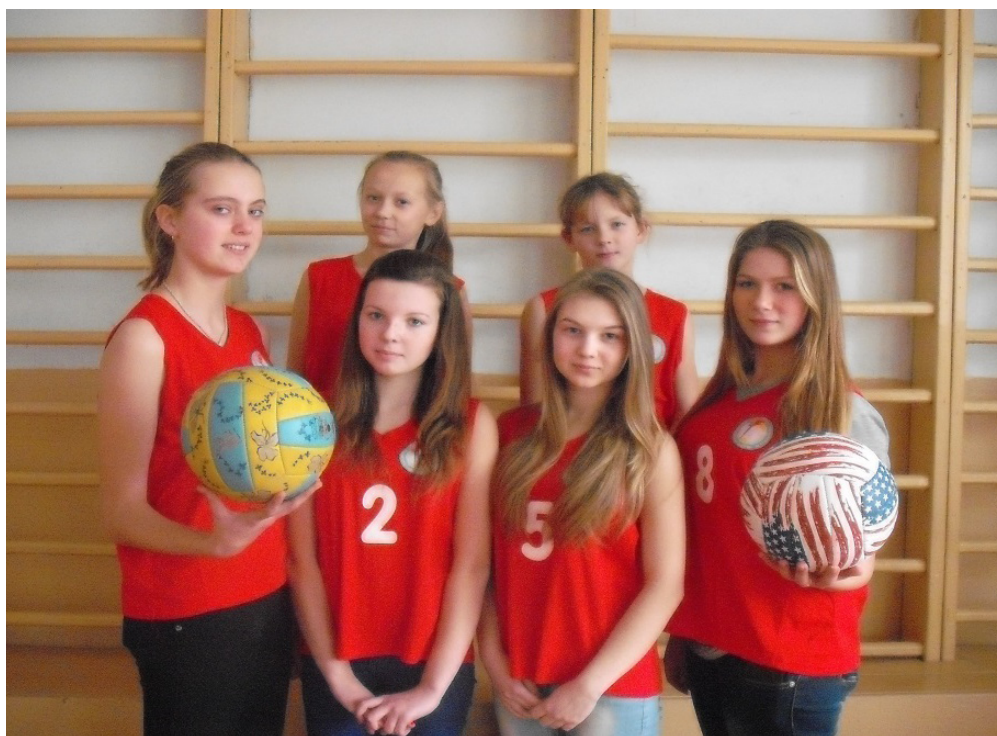
Фото 8. Команда ліцеїстів з баскетболу

Житомирський Державний університет імені І. Франка допомагає педагогічному та учнівському колективам впевнено крокувати у майбутнє, бути на перших позиціях у навчанні, дослідницькій діяльності, проведенні семінарів, конференцій, зустрічей з обміну думками та досвідом, цікаво та ефективно працювати та навчатися і не зупинятися на досягнутому.