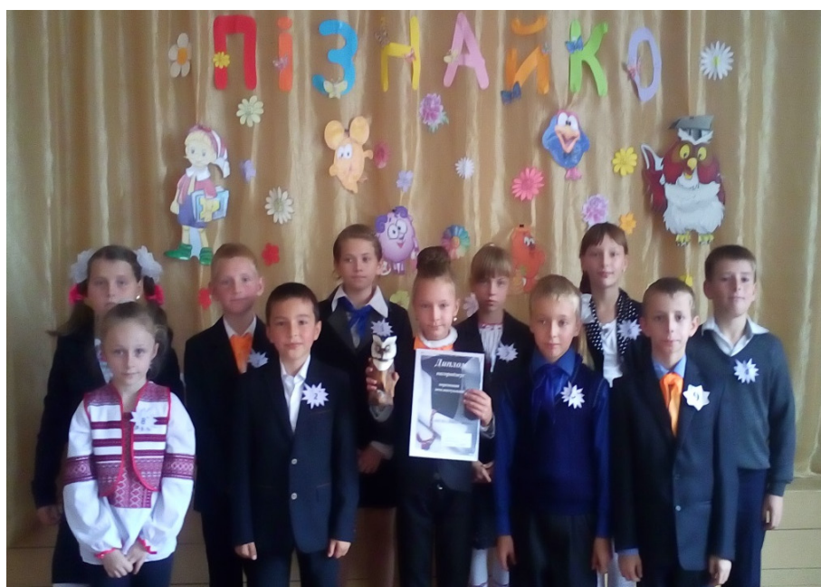
Фото 1. Учасники фінальної гри «Пізнайко – 2016» учні 3–4 класів

класів: «Пізнайко» (3–4 класи), «Розумники і розумниці» (5–6 класи), «Ерудит» (7–8 класи), «Інтелект» (9–11 класи). Діти ретельно готуються до цих конкурсів, охоче беруть в них участь.