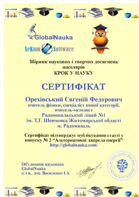
Сертифікат вчителя фізики Є.Ф.Орехівського