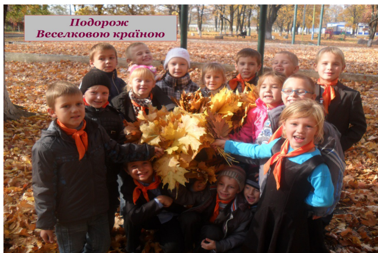
Фото 7. Ми творимо веселкову країну