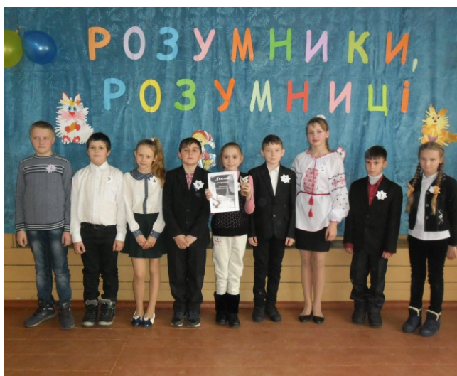
Фото 4. Учасники фінальної гри «Розумники, розумниці – 2016» учні 5–6 класів

Особливу роль в розвитку творчого потенціалу ліцеїстів відіграє їх залучення до науково-дослідницької діяльності у межах діяльності Науково-дослідницького товариства (НДТ) «Пошук». Цією діяльністю займаються ліцеїсти 3–11-х класів, які виявляють інтерес і здібності до такого виду діяльності. НДТ «Пошук» об'єднує молодих науковців, які у процесі написання наукових робіт і проектів набувають умінь самостійно працювати з інформаційними джерелами, визначати мету, аналізувати та систематизувати отриману інформацію, проводити дослідження та експерименти під керівництвом досвідчених учителів, які водночас є науковими керівниками.