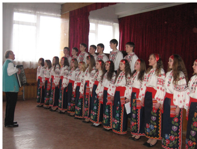
Фото 6. Виступ хорового колективу ліцею 20 квітня 2012 року

обласною атестаційною комісією та присвоєно звання «Зразковий аматорський дитячий хоровий колектив».