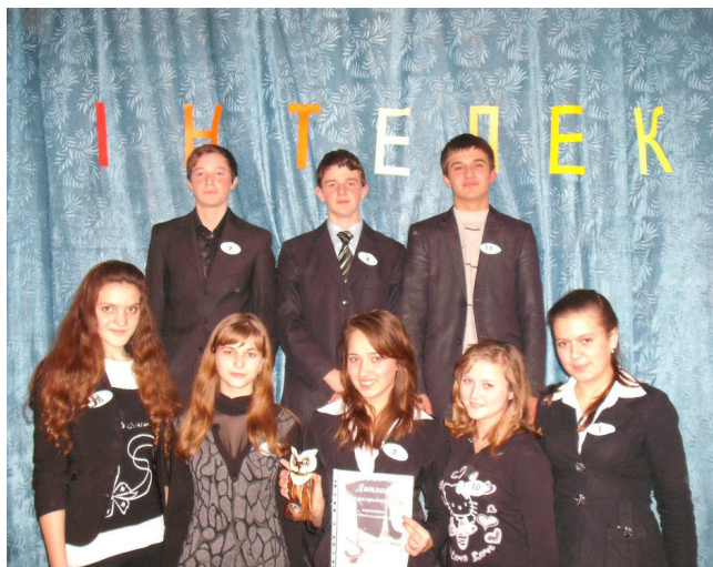
Фото. 2. Учасники фінальної гри «Інтелект» учнів 9–11 класів