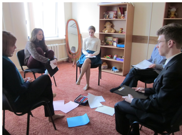
Ми під час тренінгу