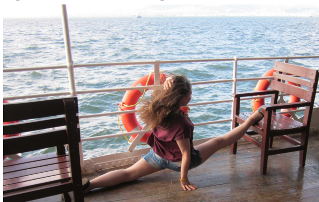
Мені це подобається

Я живу в місті Чернівці з батьками. Оскільки я – меломан, обожнюю музику, особливо класичну та легкий рок. Мої улюблені інструменти – це піаніно та віолончель (нажаль я не вмію грати на віолончелі). Упродовж 10 років займаюсь художньою гімнастикою. Також дуже люблю спорт, 2 роки тому виконала нормативи Кандидата у Майстри спорту України, отримала посвідчення та орден.