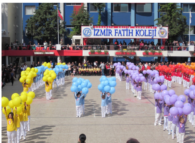
В Ізмірському коледжі

Похід до Ізмірського коледжу був найвеселішою подією. Особливо вразило те, як танцювали маленькі дітки, але і сам вигляд коледжу надихнув мене до величезної праці вдома. Я б дуже хотіла навчатись у таких чудових закладах.