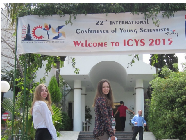
Полинула у чудові краєвиди Туреччини

Другий день, я бачу перед собою відкритий ноутбук і не знаю, що написати. У мене немає слів. Я їхала на ICYS із певними цілями, а повернулася з багатьма новими. Я на власні побачила, як потрібно презентувати власні наукові доробки. Зрозуміла, що не можна ніколи здаватись і весь час потрібно йти вперед. Переконалася також, що світ ширший ніж уявляла собі, що проблем не існує і що будь-які проблеми, маючи бажання, можна розв'язати. Зрозуміла, що багато речей, про які думала, у природі не існує. Змінила власне бачення про Туреччину та її жителів.