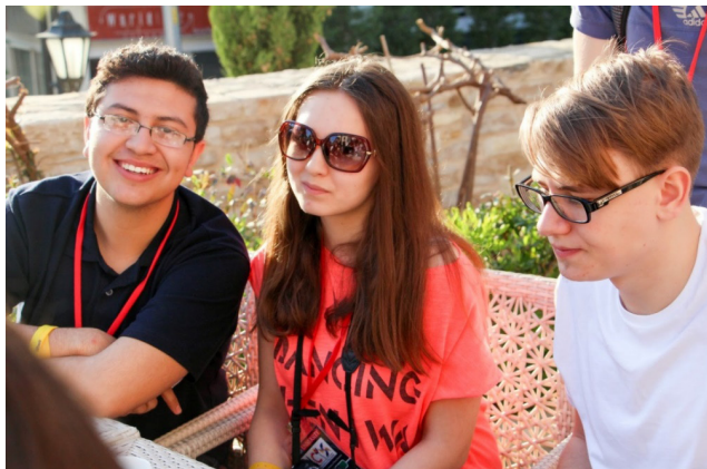
У роздумах щодо результатів власного дослідження

На третій день я здружилась з багатьма учасниками – почались веселі, безтурботні дні, але з тривогою в серці: «Яке ж місце, і чи є воно у мене???».