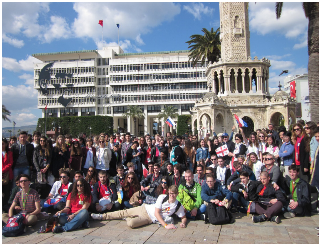
Фото на пам'ять