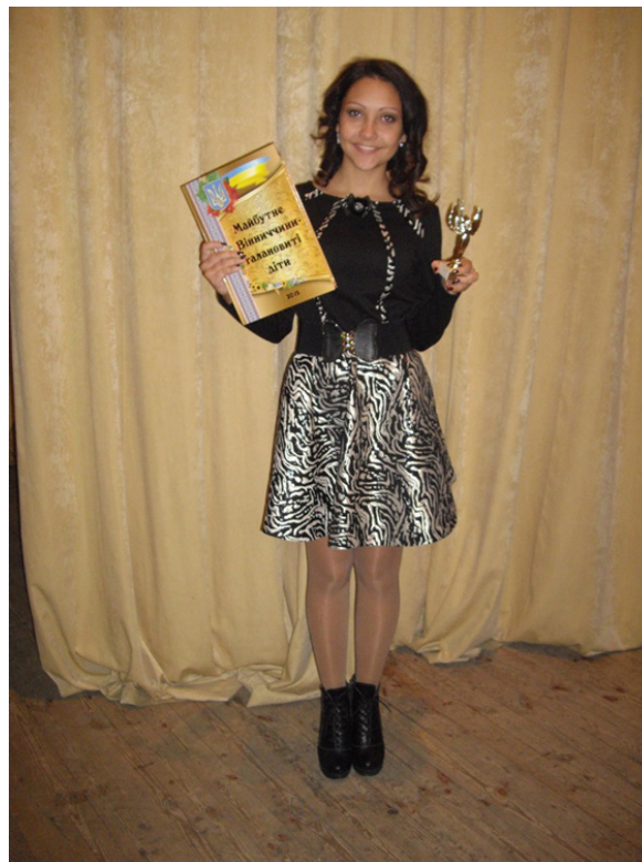
Мені вручили книгу «Майбутнє Вінниччини – талановиті діти»