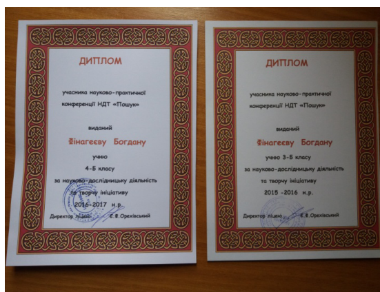
За науково-практичну конференцію НДТ «Пошук» 2015–2016 та 2016–2017 навчальних років