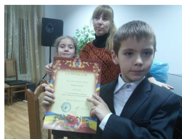
За конкурс юних піаністів ім. Лятошинського 2014 р.