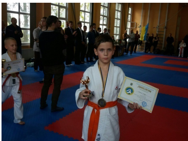
Диплом та кубок «За кращу техніку» з рукопашного бою 2016 р.