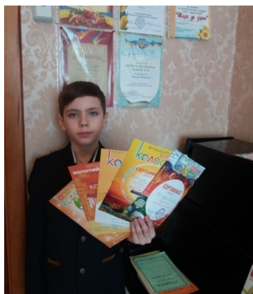
Призер конкурсу «Колосок» 2014–2017 рр.