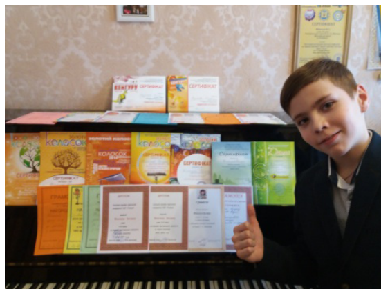
Досягнення учня 2013–2017 рр.