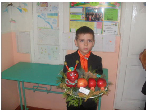
Перше місце у олімпіаді з трудового навчання