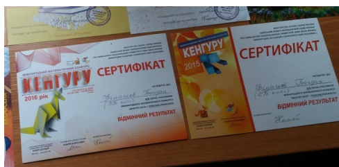
Відмінний результат конкурсу «Кенгуру» 2015 р., 2016 р.