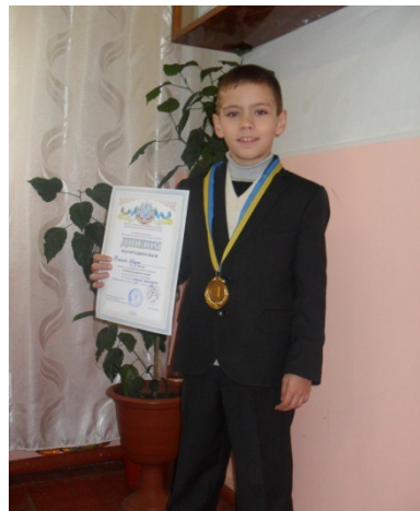
Диплом за I місце кубку Радомишльського району з рукопашного бою серед юніорів та юнаків 2014 р.