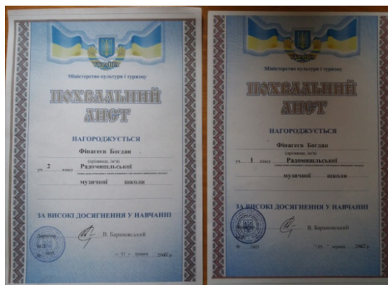
Похвальні листи за високі досягнення у навчанні 2015–2016 рр.