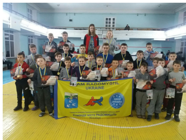
На чемпіонаті Житомирської області з кікбоксингу «Пансіонарії Крут»