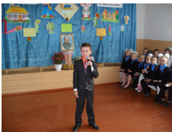
Участь в конкурсі читців творів Т. Г. Шевченка 2015 р.