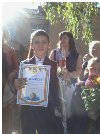
Похвальні листи за високі досягнення у навчанні 2014–2015 та 2015–2016 навчальні роки