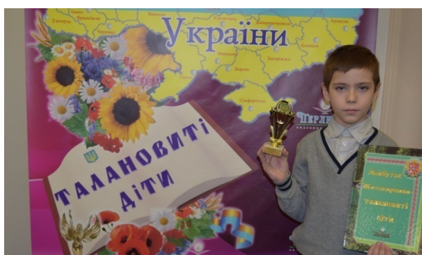
Участь у проекті «Майбутнє Житомирщини – талановиті діти»

Юному відміннику, музиканту, спортсмену – Богом даній обдарованій особистості – широкого шляху на всіх лініях життя.