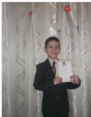
Участь в конкурсі ілюстрацій до творів Т. Г. Шевченка