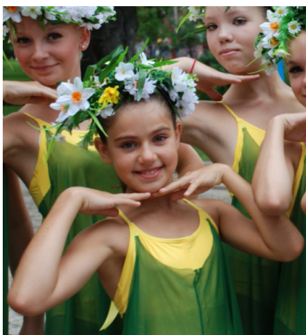
Фото 6. Перемога на танцювальному конкурсі «Найкраща команда країни»