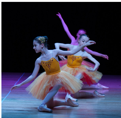
Фото 7. На концерті до Дня Незалежності України