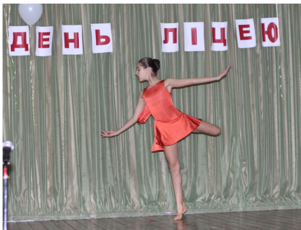
Фото 4. Виступ на святі до Дня ліцею