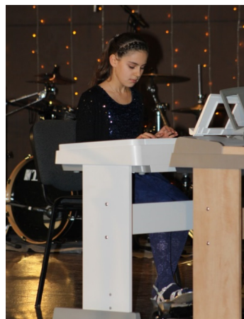
Фото 5. Концерт у музичній студії «Yamaha»