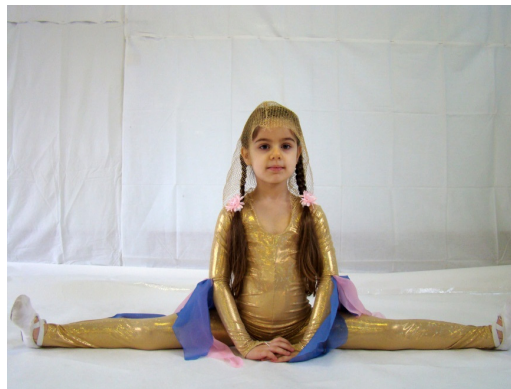
Фото 3. У цирковій студії

на «відмінно», займалася акробатикою у цирковій студії. Батьки завжди допомагали донечці та підтримували її в будь-яких починаннях і прагненнях.