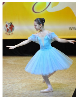
Фото 9. Концерт у хореографічній школі-студії «FORS»