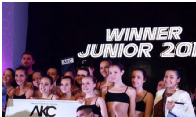
Фото 8. На фестивалі «Столиця запрошує»