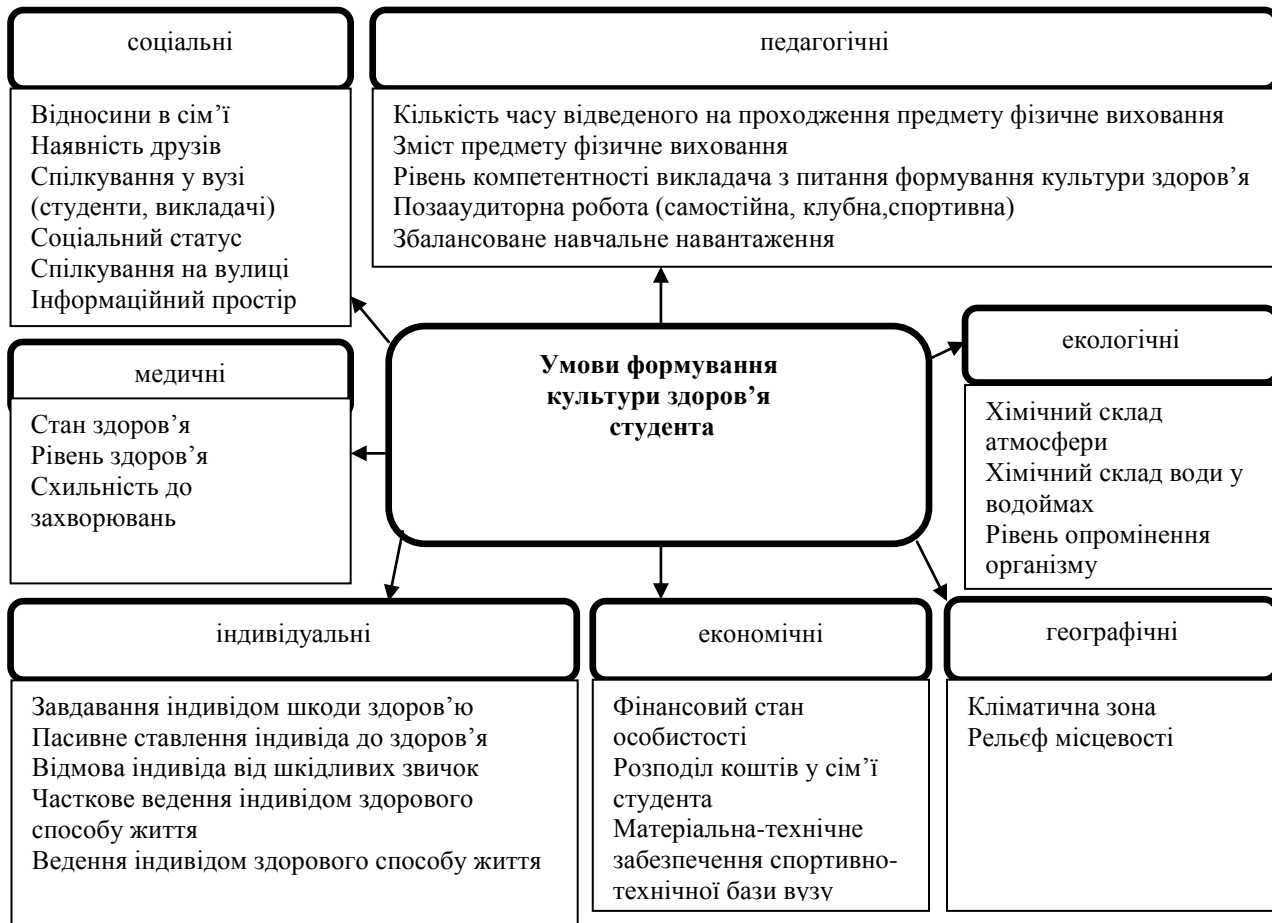
Рис.1. Умови формування культури здоров'я студента