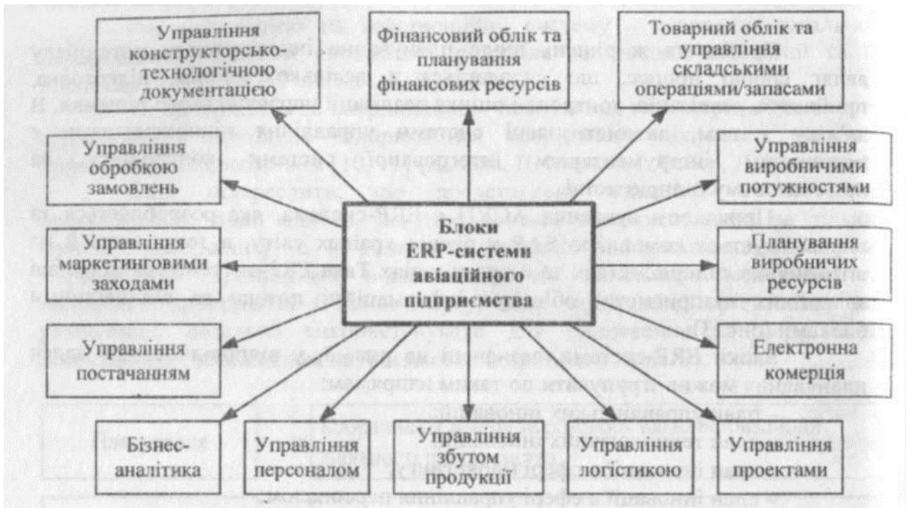
Рисунок. 3. Блоки KRP-системи контролінгу інноваційної діяльності авіаційного підприємства

Інтегральний моніторинговий показник стану інноваційного потенціалу авіаційного підприємства IP передбачається визначати як відношення інтегрального фактичного моніторингового показника \sum Pvid_{ij} щодо i -ї складової інноваційного потенціалу підприємства до інтегрального критеріального моніторингового показника \sum Pvid_{ij}^{\max}