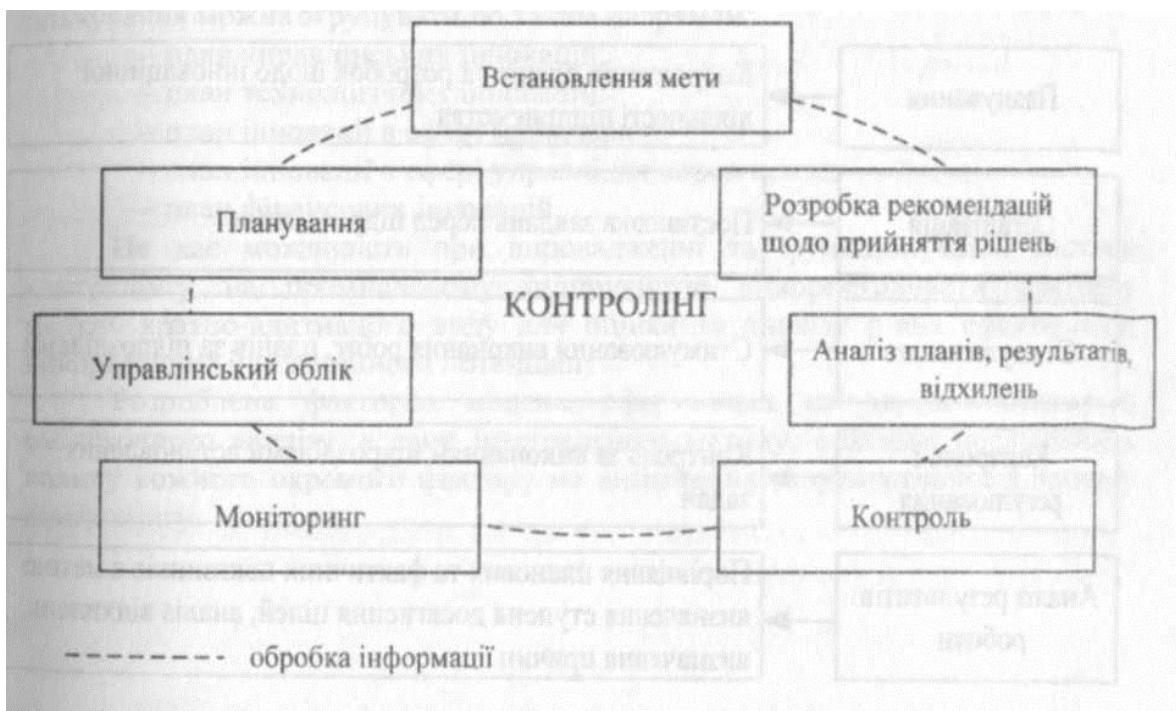
Рисунок 1. Інформаційний потік в системі контролінгу

Контролінг безпосередньо пов'язаний з процесами інформатизації прийняття управлінських рішень (рис. 1). У зв'язку з тим, що контролінг управляє результатом, менеджмент відповідає за результат, а інформаційні системи служать індикатором досягнення результату, в їх взаємодії виникає зона конфлікту. Це передбачає визначення пріоритетності контролінгу та використання на постійній основі методів прогнозування, моніторингу, аналізу та коригування діяльності підприємства і його підрозділів, а також відомостей про стан ринків в умовах конкуренції.