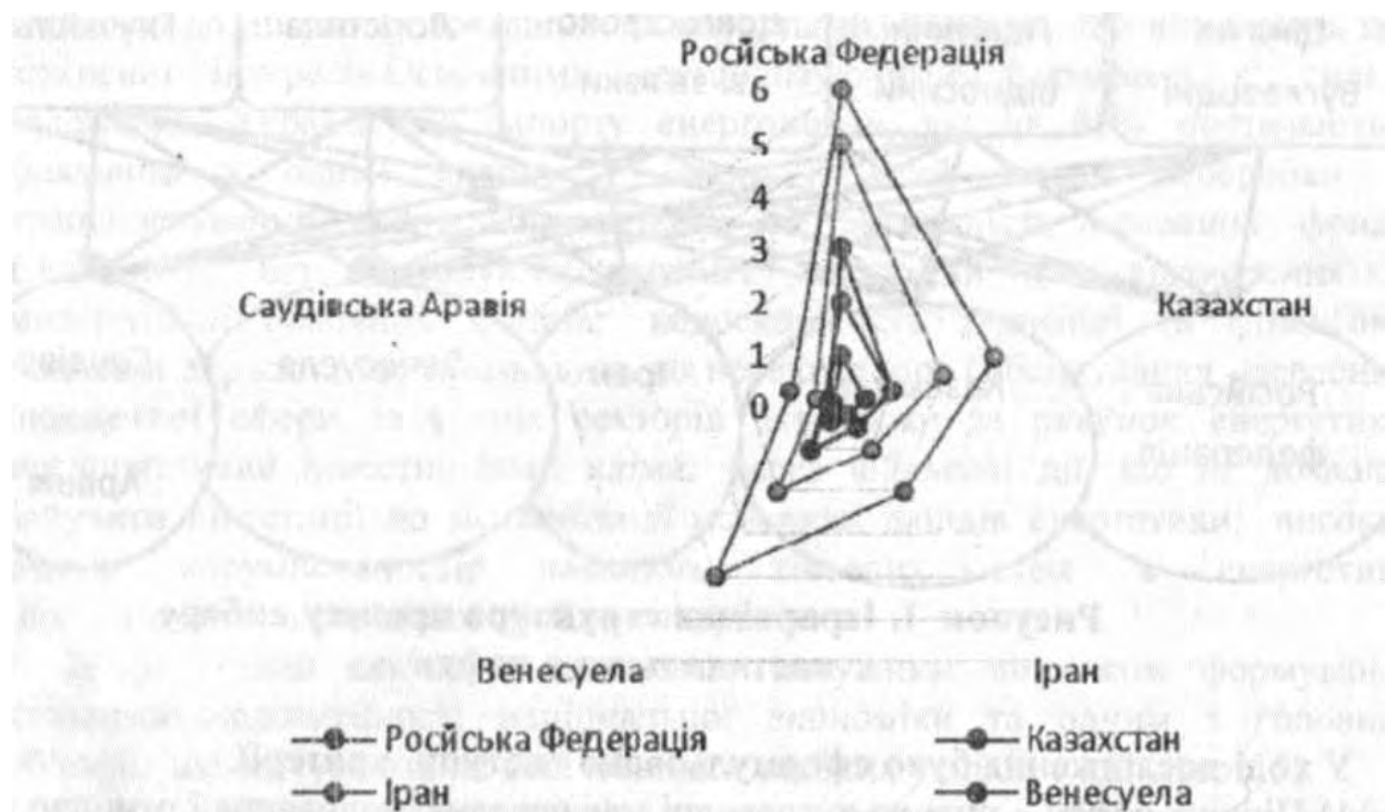
Рисунок 2. Оцінки попарних порівнянь для політичних відносин

Найважливішим критерієм було обрано політичні відносини між Україною та обраними державами. На рис.2 згідно застосованого методу аналізу ієрархій зображено оцінки попарних порівнянь для політичних відносин.