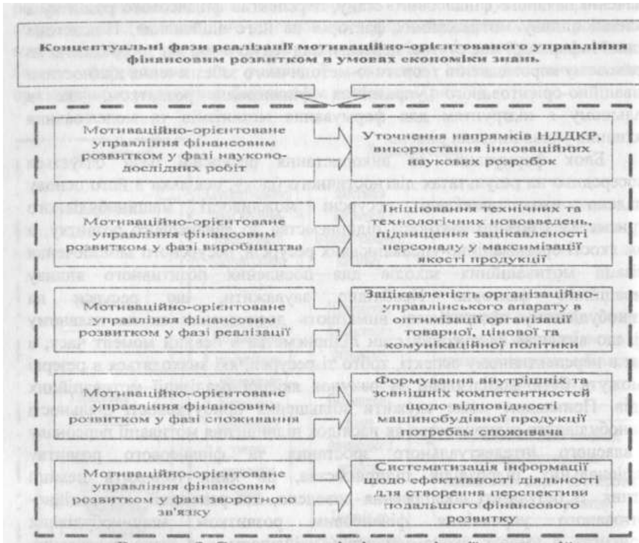
Рисунок 3. Систематизація фаз реалізації мотиваційно-орієнтованого управління фінансовим розвитком машинобудівних підприємств в умовах економіки знань

Висновки даного дослідження і перспективи подальших робіт у цьому напрямку. Таким чином, у результаті науково обґрунтовано виділення характерних особливостей процесу формалізації концептуальних основ мотиваційно-орієнтованого управління фінансовим розвитком в умовах економіки знань, підкреслено спрямованість їх на досягнення кінцевого стратегічного результату. Визначено, що стратегічний аспект мотиваційно-орієнтованого управління фінансовим розвитком машинобудівних підприємств у мовах економіки знань базується на проведенні системного аналізу його організаційно-управлінських та мотиваційно-орієнтованих ресурсів і його діяльності за довгостроковий період та плануванні системи заходів у фінансовому аспекті, які б у прогнозованому періоді гарантували стабільність роботи підприємства та перспективу його фінансового розвитку. Перспективою подальшого