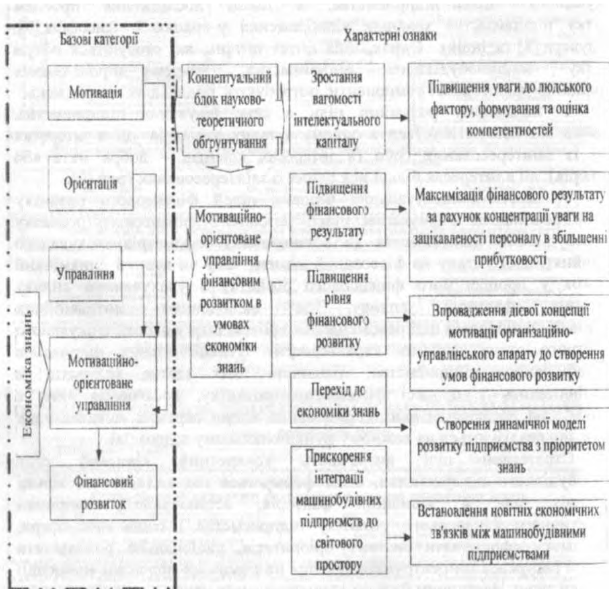
Рисунок 2. Концептуальний блок науково-теоретичного обґрунтування мотиваційно-орієнтованого управління фінансовим розвитком машинобудівних підприємств

розвитку фінансових відносин. Концептуальний блок науково-теоретичного обґрунтування мотиваційно-орієнтованого управління фінансовим розвитком машинобудівних підприємств містить у собі ключові елементи теоретичного базису формування та реалізації основних положень мотиваційно-орієнтованого управління фінансовим розвитком (рис. 2).