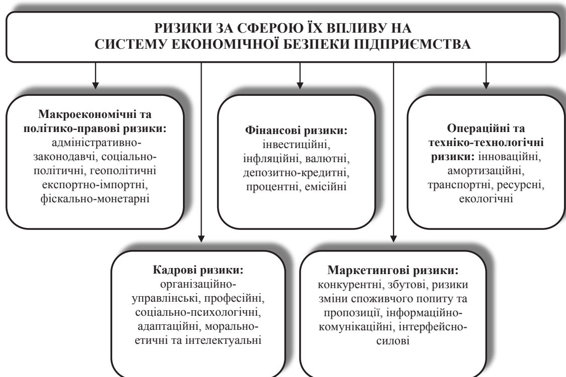
Рис. 2. Класифікація ризиків за сферою їх впливу на систему економічної безпеки підприємства

Отже, відсутність конкретного результату функціонування системи економічної безпеки підприємства є доказом наявності тільки сукупності окремих її елементів, які не мають тісного діалектичного взаємозв'язку. З позиції цього дослідження критерієм ефективності системи економічної безпеки підприємства доцільно визначити забезпечення її рівноважного стану,