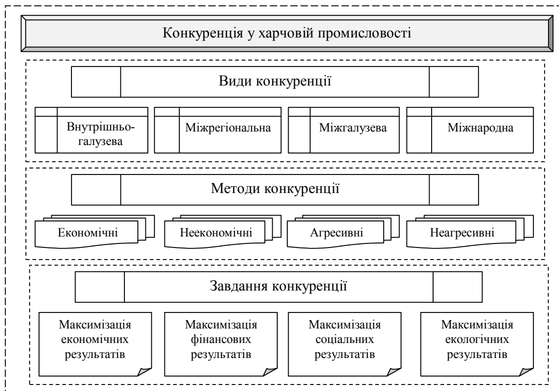
Рис. 1. Сегментна структура конкуренції у харчовій промисловості

– соціальні-економічні – формують систему явищ, які мають вплив на рівень продуктивності праці у харчовій промисловості з урахуванням рівня забезпеченості працівників, їх працездатності, компетентності та ін.;