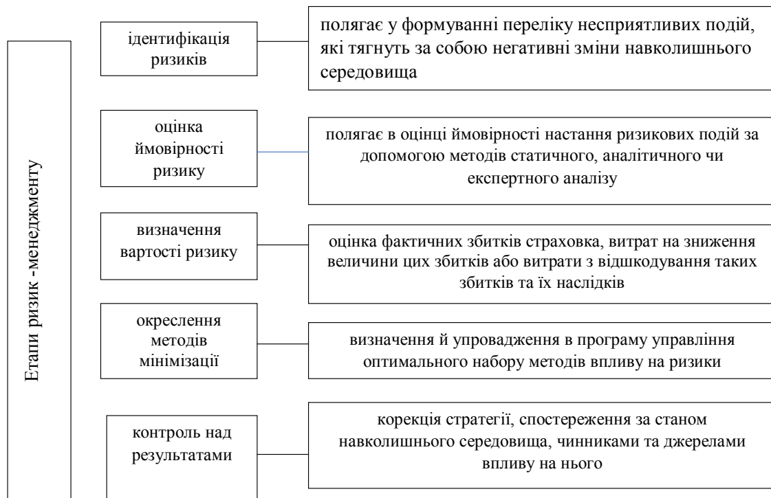
Рис. 1. Етапи управління ризиками страхівка

запобігання ризику; зниження ризику; диверсифікація ризиків; самострахування; хеджування [4, с. 226-229].