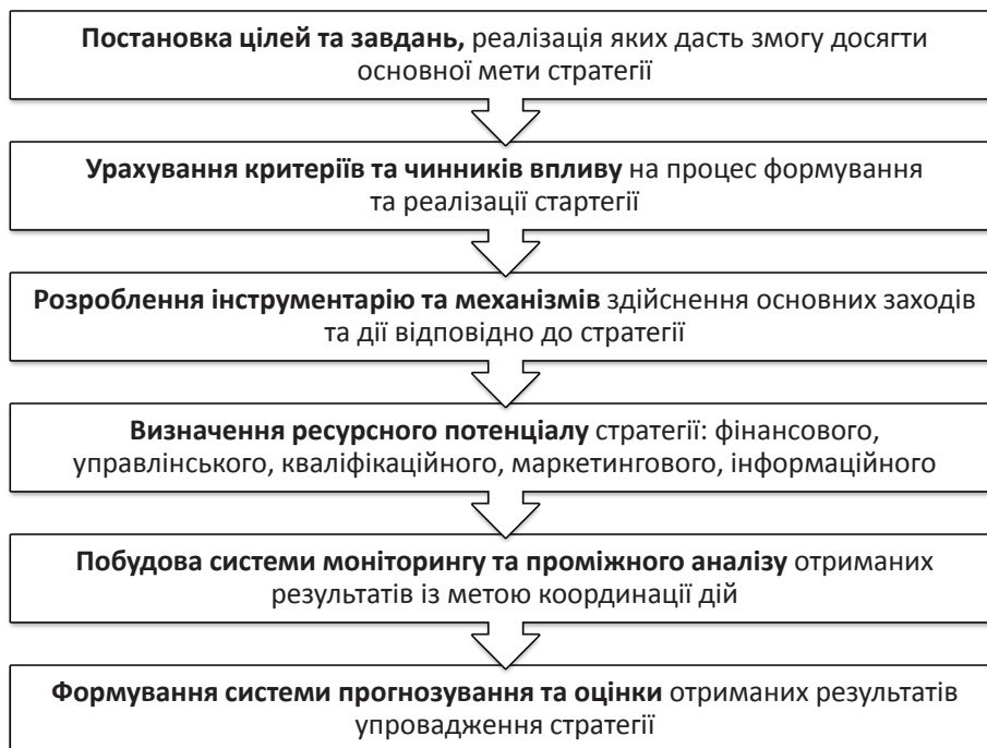
Рис. 1. Етапи формування Державної стратегії розвитку органічного сектору сільськогосподарської галузі України

Науково-освітня та дорадча підтримка включає: створення системи інформаційно-консультативних закладів, платформ знань, дорадчих