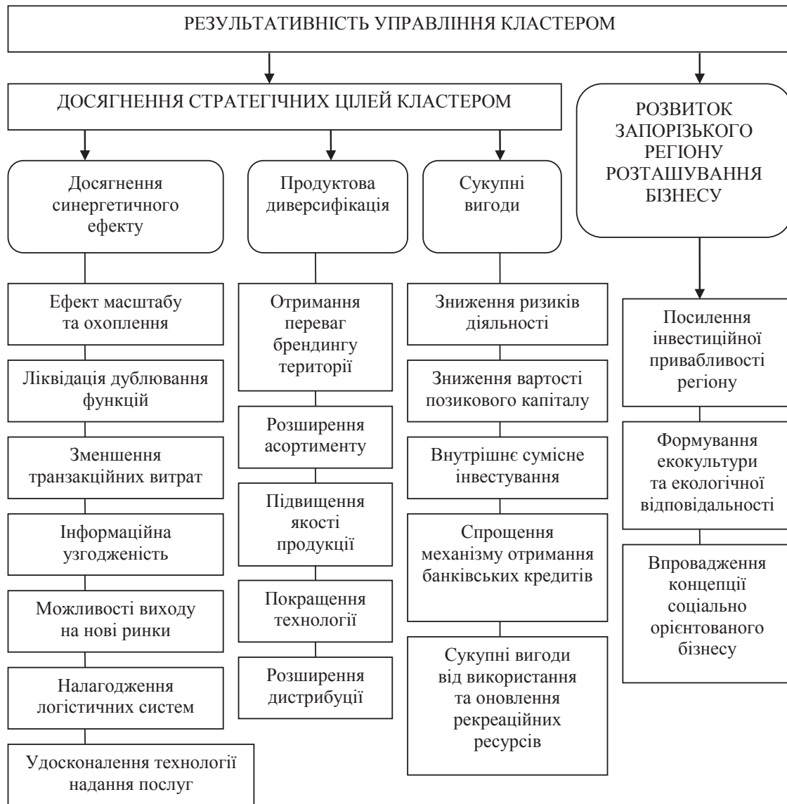
Рис. 1. Результативність туристичного кластеру

З огляду на особливості туристичної галузі підвищити ефективність функціонування туристичного кластеру в Запорізькому регіоні можна за допомогою узгодження стратегії розвитку з елементами організаційно-економічного механізму та реалізації відповідних методів і прийомів організаційно-економічного механізму на мікро-, мезо- та макрорівнях, що схематично наведено на рис. 2.