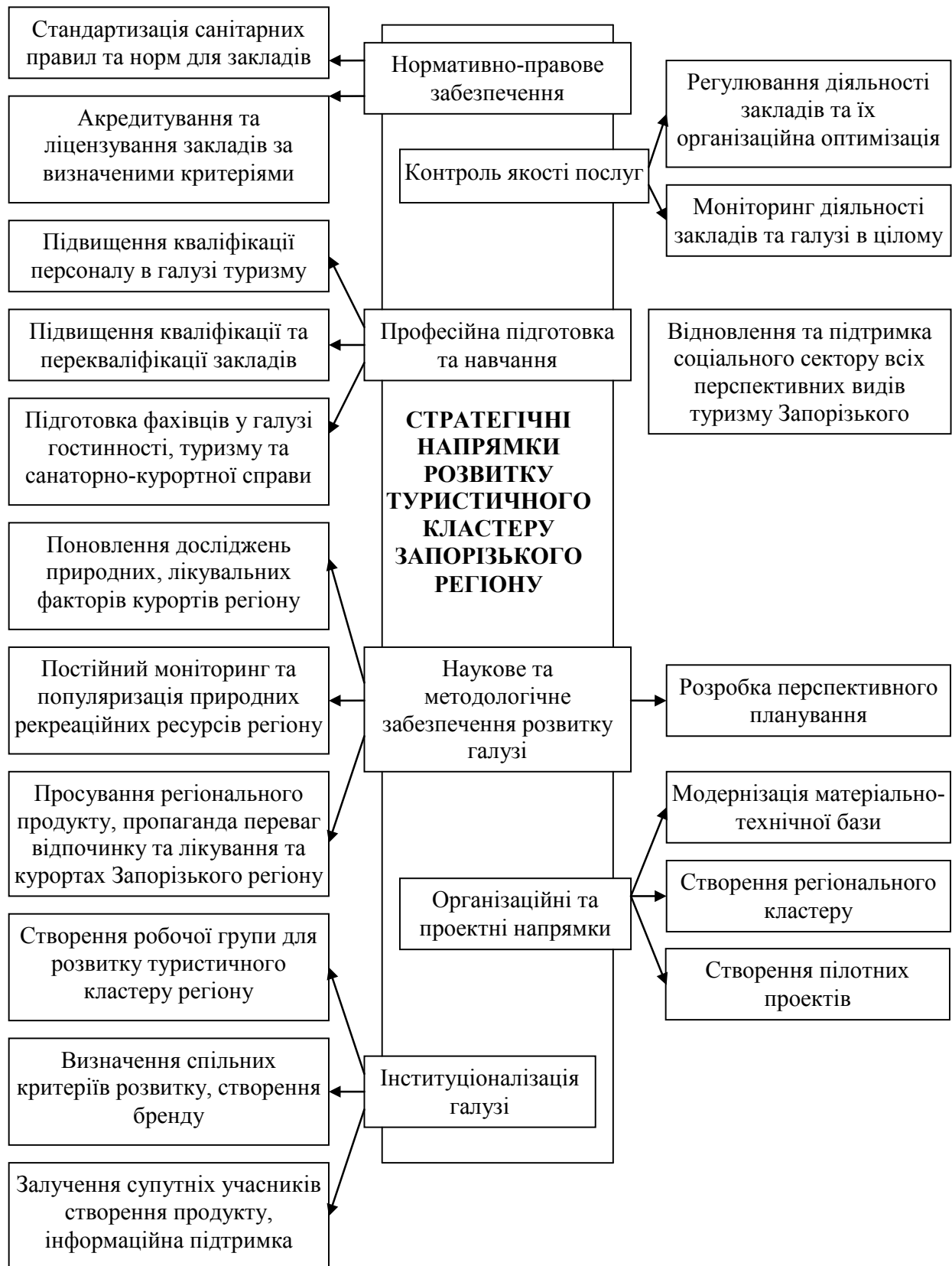
Рис. 3. Стратегічні напрями розвитку туристичної галузі Запорізького регіону