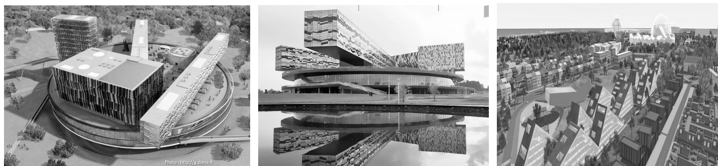
Рис. 6. Энергоэффективный инновационный центр в Сколково (Россия) [17].

Москва. Проект "Энергоэффективный жилой дом в микрорайоне Никулино-2" (экспериментальный 16-этажный дом) был реализован в 1998-2002 годах в рамках "Долгосрочной программы энергосбережения в Москве". Для мероприятий по энергосбережению, были исполь-