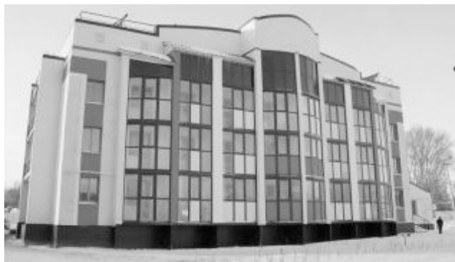
Рис. 9. Энергоэффективный дом (Барнаул, Россия) [21].

Новосибирск. С 1987 года в Новосибирском Академгородке на базе институтов СО РАН создано общественное объединение «Сибирский эксперимент» для строительства индивидуальных домов сотрудникам институтов. Одновременно организован инженерно-технический «Центр экологического домостроения». В 1992 году был разработан первый про-