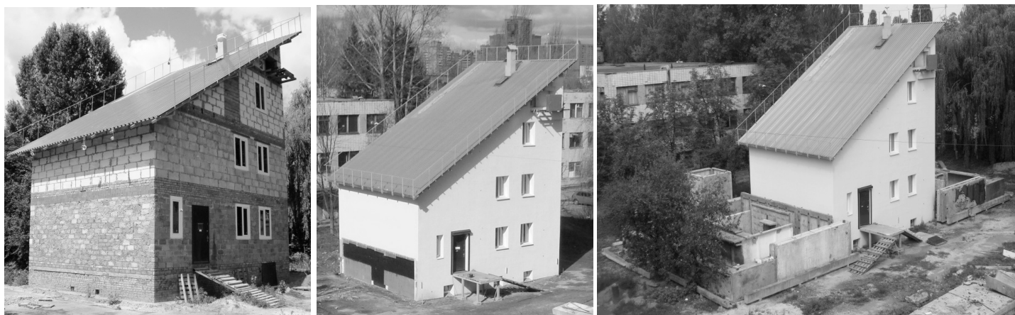
Рис. 1. Энергоэффективный дом пассивного типа «ноль энергии» (Институт технической теплофизики НАН Украины, г. Киев, Украина).

Вентиляция – трехвалентная система: 1) при-