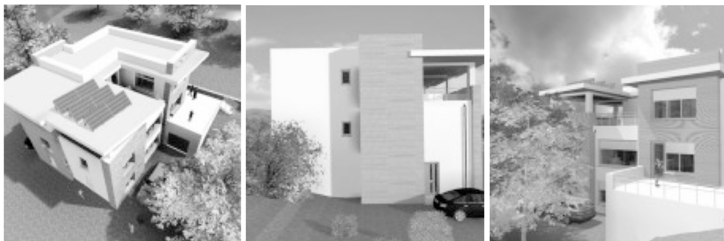
Рис. 4. Эскиз проекта пассивного дома PCQ (Молдова) [10].

Плановое подорожание строительства: + 10 %