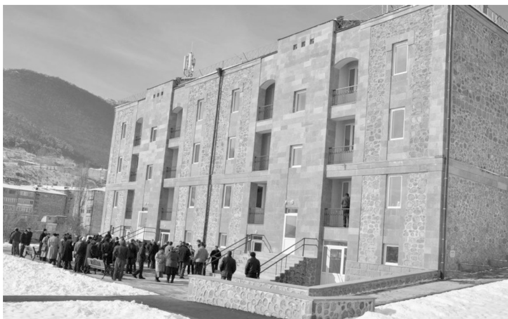
Рис. 5. Энергоэффективный жилой дом в г. Горис (Армения) [16].

Россия. Общая площадь всех зданий, эксплуатируемых в России составляет около 5 млрд. м 2 . Для их отопления необходимо 400 млн. тонн условного топлива в год или более трети энерго-ресурсов страны. Особенно остро эта проблема стоит в коммунальном хозяйстве, которое потребляет до 20 % электрической и 45 % тепловой энергии, производимой в стране. На единицу жилой площади в России расходуется в 2...3 раза больше энергии, чем в Европе. И это не является следствием холодного климата. Несмотря на