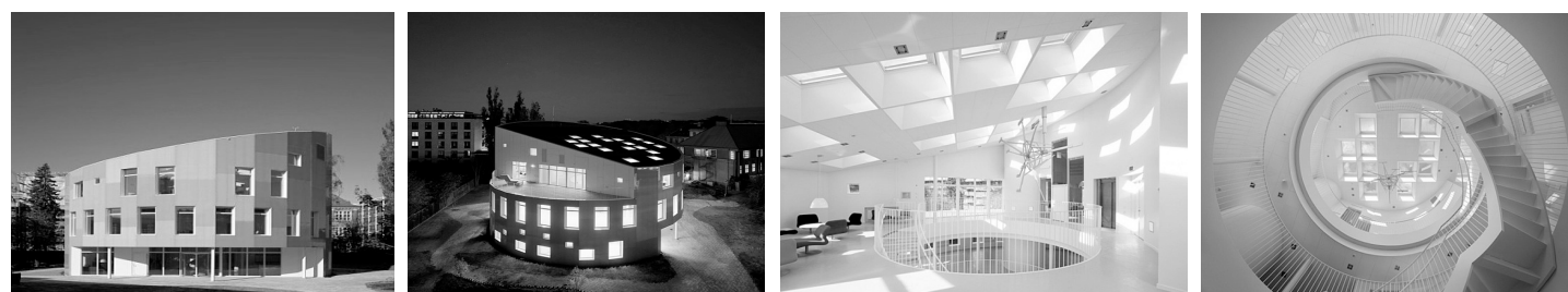
Рис. 7. Экологически чистое здание "Зеленый маяк" (Дания) [18].