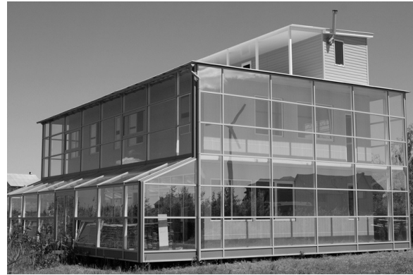
Рис. 3. Частный энергоэффективный дом пассивного типа в Киевской обл. (Украина) [8].

ревянный брус сечением (50×150) мм. Каркас обшит плитами ОСП, прочность которых в полтора раза выше, чем прочность дерева такой же толщины. Толщина стены между плитами ОСП – 150 мм. Это пространство заполнялось пеноизолом. Пеноизол не горит (пожароустойчив), его не едят грызуны и при попадании в почву служит удобрением.