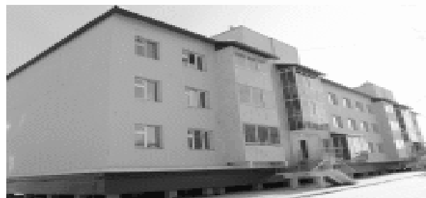
Рис. 8. Энергоэффективный дом (Якутия, Россия) [20].

В «умном доме» предусмотрено автоматическое поддержание температуры теплоносителя в зависимости от внешней температуры, дистанционное управление параметрами теплоносителя с помощью электронного узла управления, приборы учета расхода количества теплоты и воды в системе отопления, холодного и горячего водоснабжения. Кроме того, освещение помещений предусмотрено с автоматическим управлением – установлены датчики движения и