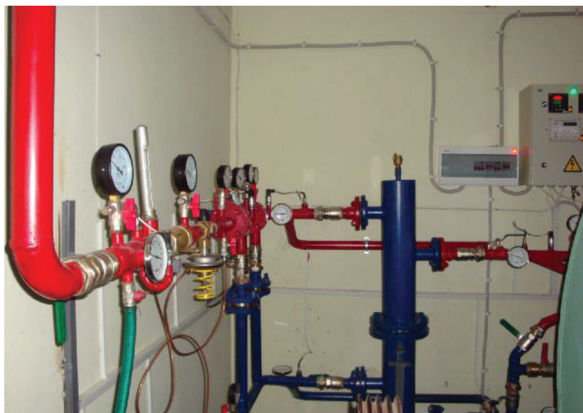
Рис. 4. Фото части ИТП с гидравлической стрелкой.

Преимущество по сравнению с традиционным элеваторным узлом - экономия теплоты от использования достигает 15...18 % за отопительный период.