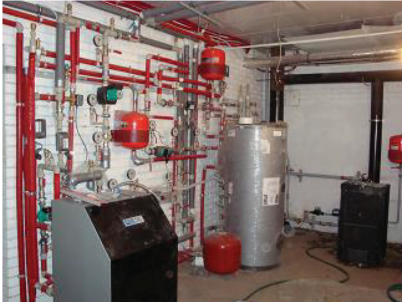
Рис. 2. Фото части теплонасосной системы теплообеспечения.

Преимущества - автономность электроснабжения; отказ от централизованных электросетей; экологичность; возможность продажи избыточной электроэнергии (например, летом, когда есть мощная инсоляция и отсутствуют потребности в отоплении) по «зеленому» тарифу; использование современных информационных smart-технологий; использование в зданиях типа «0-энергии» (где энергия потребляется в необходимом количестве, но генерируется собственно домом или на придомовой территории).