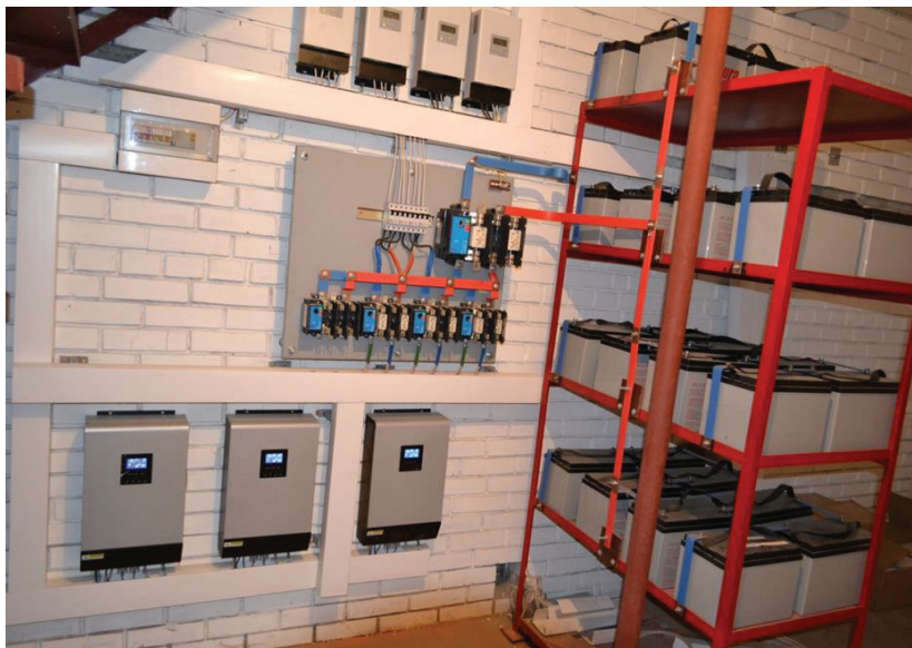
Рис. 3. Фото аппаратной части системы автономного электроснабжения.