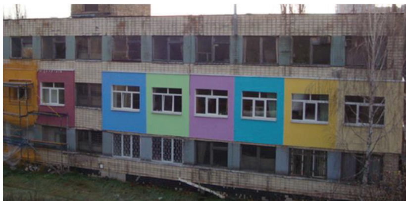
Рис. 6. Фото разновариантной термомодернизации части корпуса ИТТФ – полигон утепления стеновых конструкций и энергоэффективных окон.