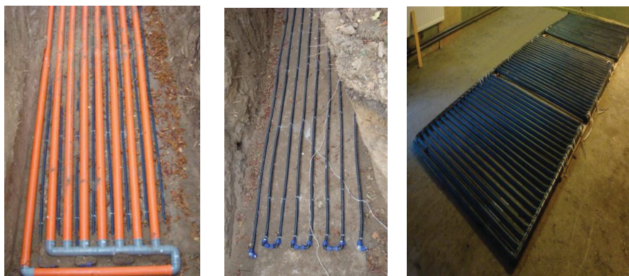
Рис. 7. Фото грунтовых теплообменников, а - типа грунт-воздух, б - типа грунт-вода, в - типа регистра.

Кроме того для исследования систем длительного аккумулирования тепловой энергии разработана система пассивной тепловой воздушной защиты фасадов пассивного дома на основании теплоты грунта; создан центр теплонасосных технологий; проводится многолетний мониторинг солнечной инсоляции и ее влияния на тепловой режим здания [13]; осуществляются метео-