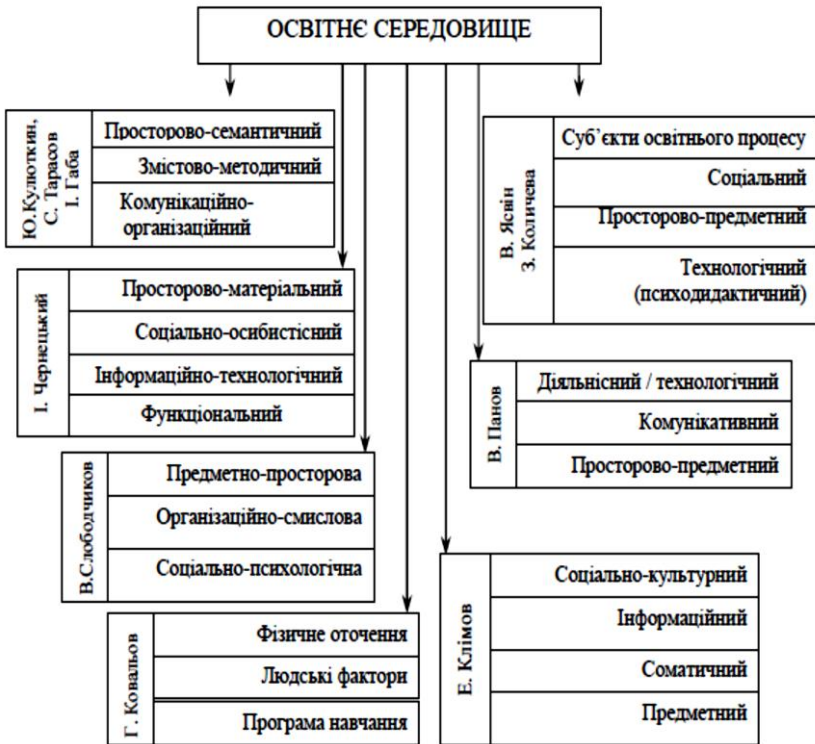
Рис. 1. Структурні компоненти освітнього середовища: сучасні наукові підходи

– соціально-особистісний («суб’єкти пізнання» (І. Чернецький) – суспільні запити, мотиви, потреби; особистісні особливості та успішність, зміна персонального та міжособистісного простору, розподілення статусів та ролей, ставово-вікові особливості студентів та викладачів (Г. Ковальов – «людський чинник»); культура, досвід, спосіб життя оточуючих («соціально-культурний» (Є. Клімов); тип культури та форма спільності вчителя / учня (В. Ясвін).