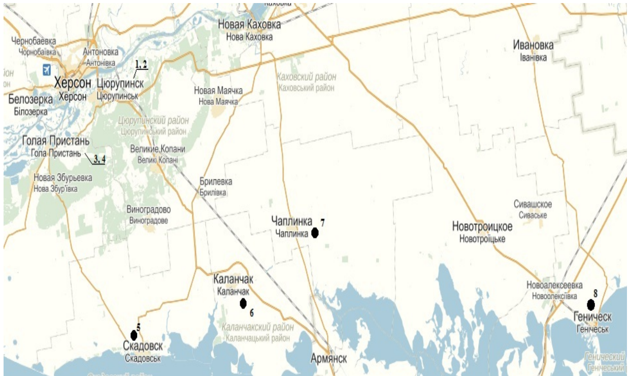
Рис.1. Територіальне місцезнаходження свердловин

рішень задач руху підземних вод фахівцями СКТБ Інституту гідромеханіки НАН України, показало незначну їх відмінність [1].