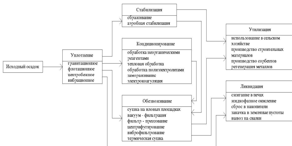
Рис. 1. Схемы обработки и утилизации осадков.

Осадки городских сточных вод содержат большое количество органических веществ, иногда их количество достигает 75%, а также могут содержать до 6 % – азота, до 8 % – фосфора, до 0,6 % – калия [4,8]. Осадок сточных вод представляет ценность как биоресурс который необходимо использовать, а не складировать. На рис. 1 представлены возможные схемы обработки и утилизации осадков. На данной схеме видно что после стабилизации осадка сточных вод, его можно использовать в сельском хозяйстве или в производстве строительных материалов. А при анаэробной стабилизации осадков сточных вод можно получать биогаз и удобрения.