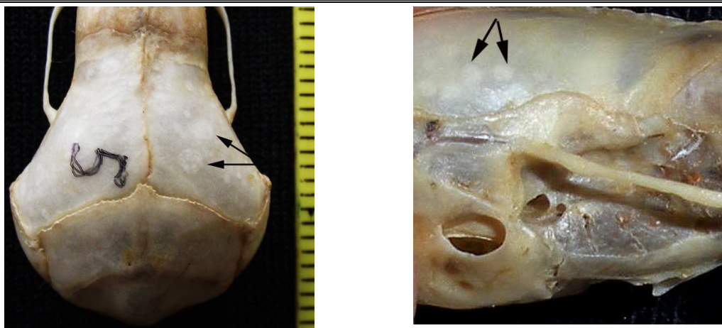
Рисунок 3. Участки просветления костной ткани.

Искривление стреловидного (сагиттального) шва выражалось в наличие крупных округлых (1–1,5 мм) впаиваний, которые, могли быть как односторонними, так и двусторонними (рис. 2). Такие изменения формы швов усиливают прочность соединения прилегающих костных тканей и являются адаптивно-приспособительными на возрастание внутричерепного давления.