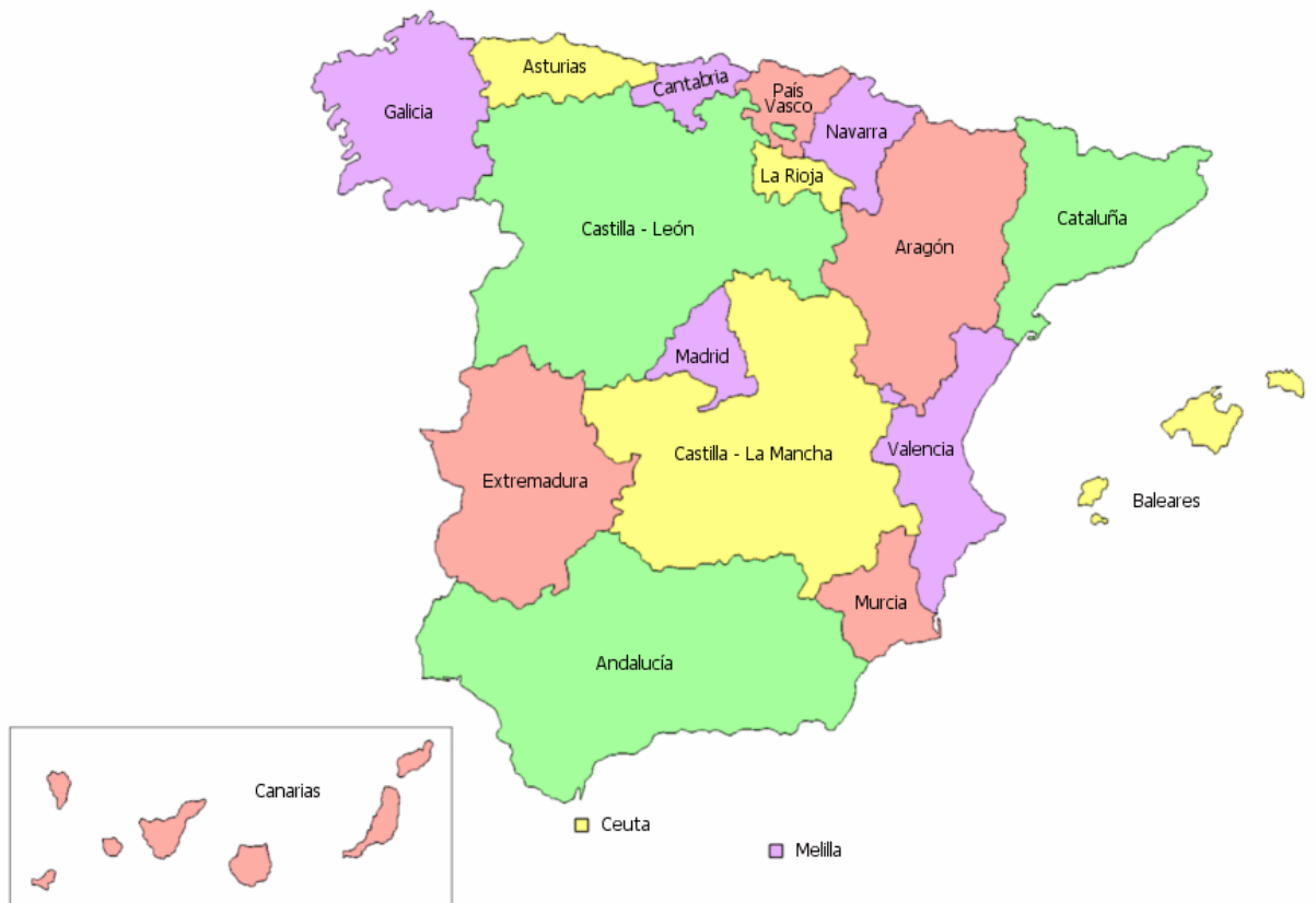
Рис. 2. Сімнадцять самоорганізованих регіонів ( Comunidades Autónomas ) [7]