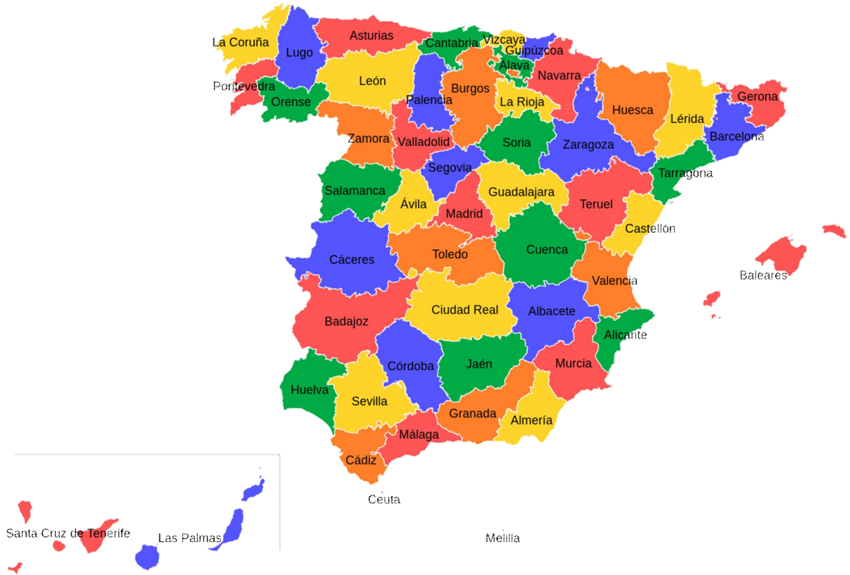
Рис. 1. П'ятдесят провінцій (сім із них у статусі самокерованої автономії)