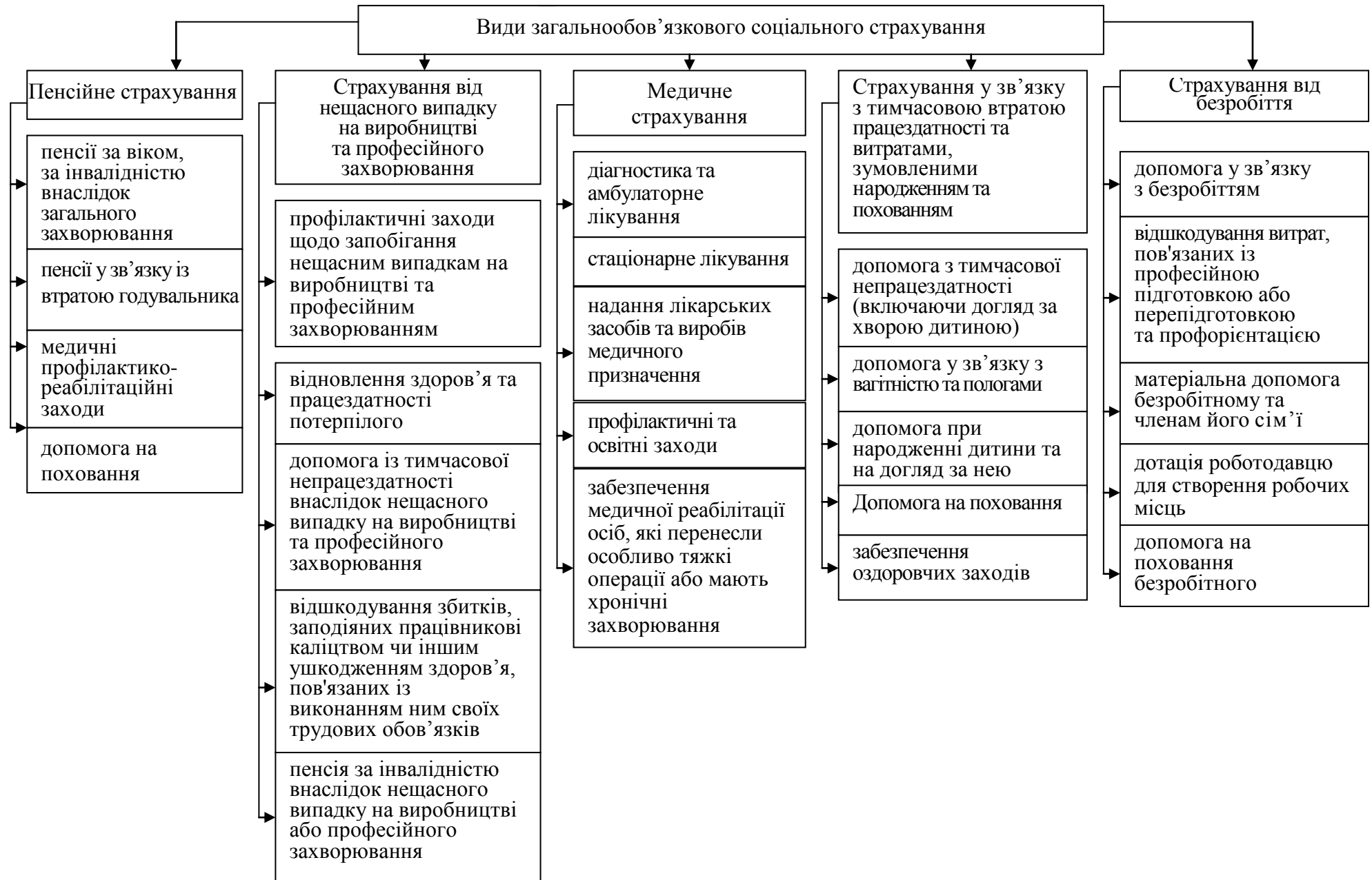
Рис. 1. Види матеріального забезпечення та соціальних послуг, що надаються за загальнообов'язковим соціальним страхуванням