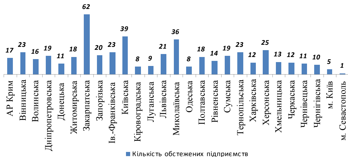
Рис. 1. Кількість обстежених підприємств у розрізі регіонів

Інформаційною базою нашого дослідження слугували матеріали обстеження 493 хлібопекарських підприємств, що дало можливість визначити проектні і фактичні потужності та обсяги виробництва хліба в розрізі регіонів і товаровиробників, джерела та механізми їх забезпечення зерном і борошном, інші техніко-економічні показники. Кількість обстежених підприємств у розрізі регіонів зображено на рис. 1.