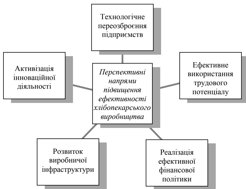
Рис. 4. Перспективні напрями діяльності хлібопекарських підприємств

В результаті проведених досліджень виокремлено основні перспективні напрями, які сприятимуть інтенсифікації хлібопекарського виробництва (рис. 4).