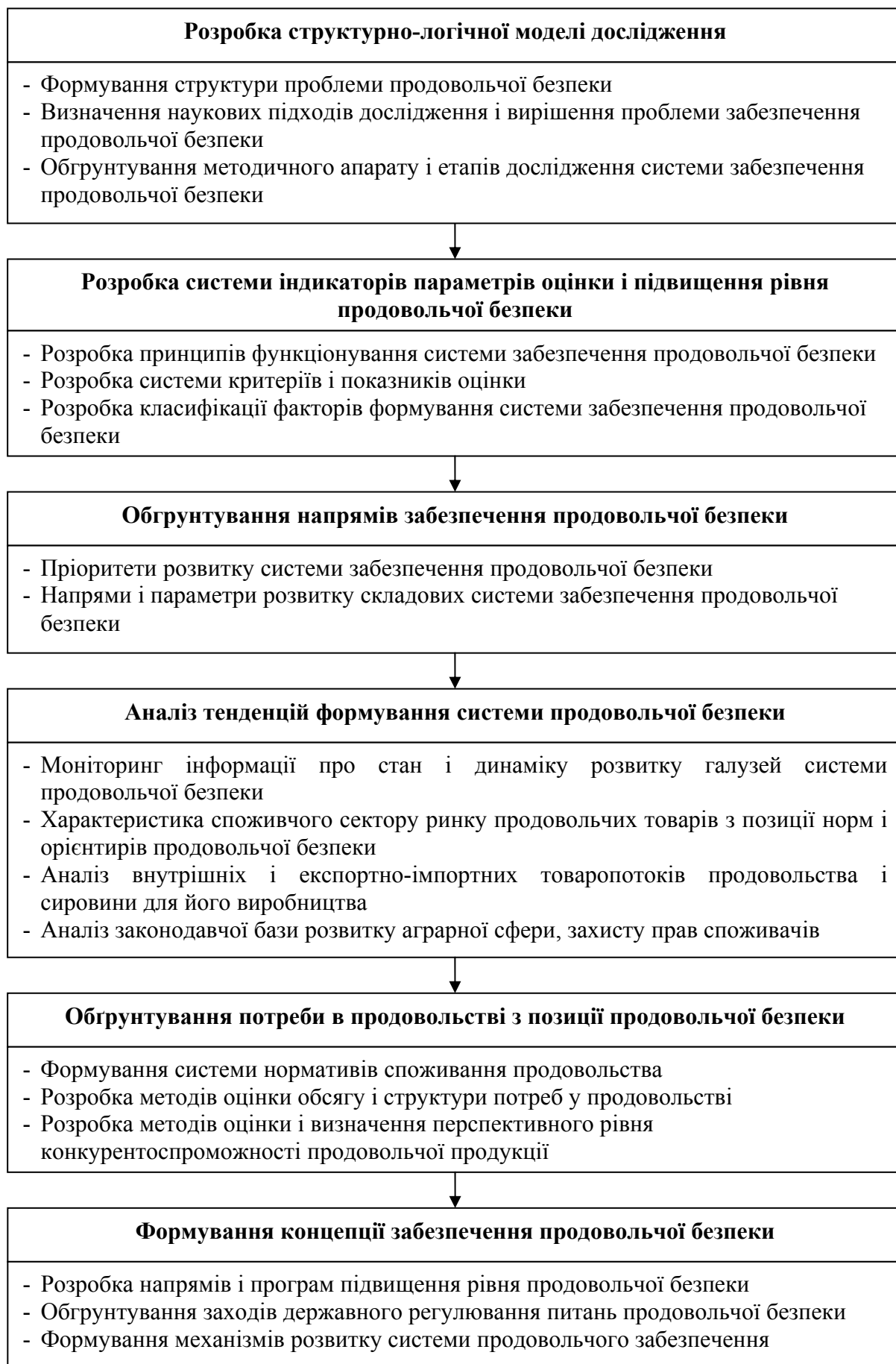
Рис. 1. Концепція дослідження системи продовольчої безпеки