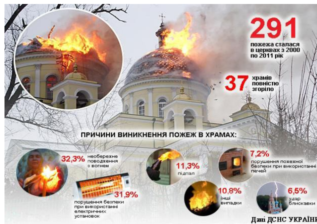
Рис. 2. Статистика пожеж у храмах України

На рисунку 2 наведена статистика найпоширеніших причин пожеж в храмах України за даними Державної служби України з надзвичайних ситуацій (ДСНС) [9].