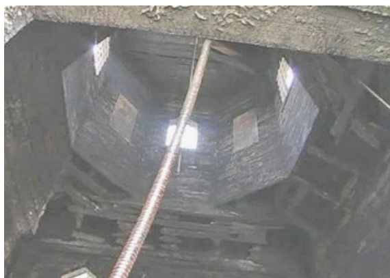
Рис. 3. Інтер'єр церкви після пожежі

Наслідки пожежі дерев'яної церкви з необробленою деревиною купольної частини Преподобної Параскеви в селі Климашівці на Хмельниччині, вік якої становив 227 років показано на рисунку 3.