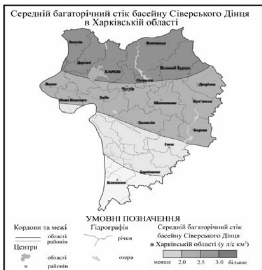
Рис.2. Середній багаторічний стік басейну Сіверського Дінця (у межах Харківської області)

Після побудови карти студент повинен дати характеристику зміні стоку