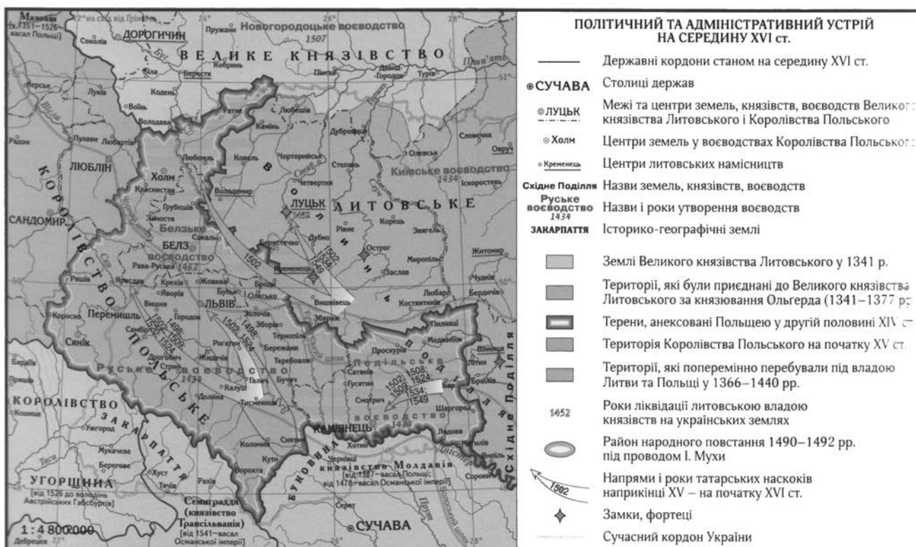
Рис. 1. Львів і Руське воєводство у складі Королівства Польського [8]

Рецензент – доктор географічних наук, професор В.А. Пересацько