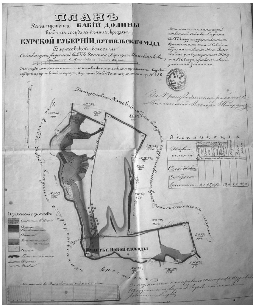
Рис. План дачі пустоші Бабій Долини (1873 р.)