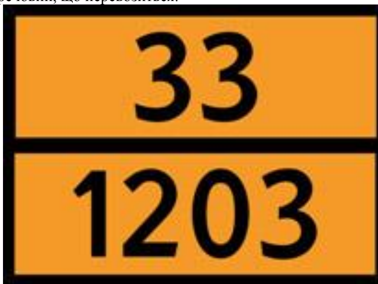
Рисунок 2 – Таблиця небезпеки згідно рекомендацій ООН.

вказує на займистість, окисну дію, отруйність, роз'їдаючу дію, небезпеку спонтанної бурхливої реакції речовин, що перевозяться.